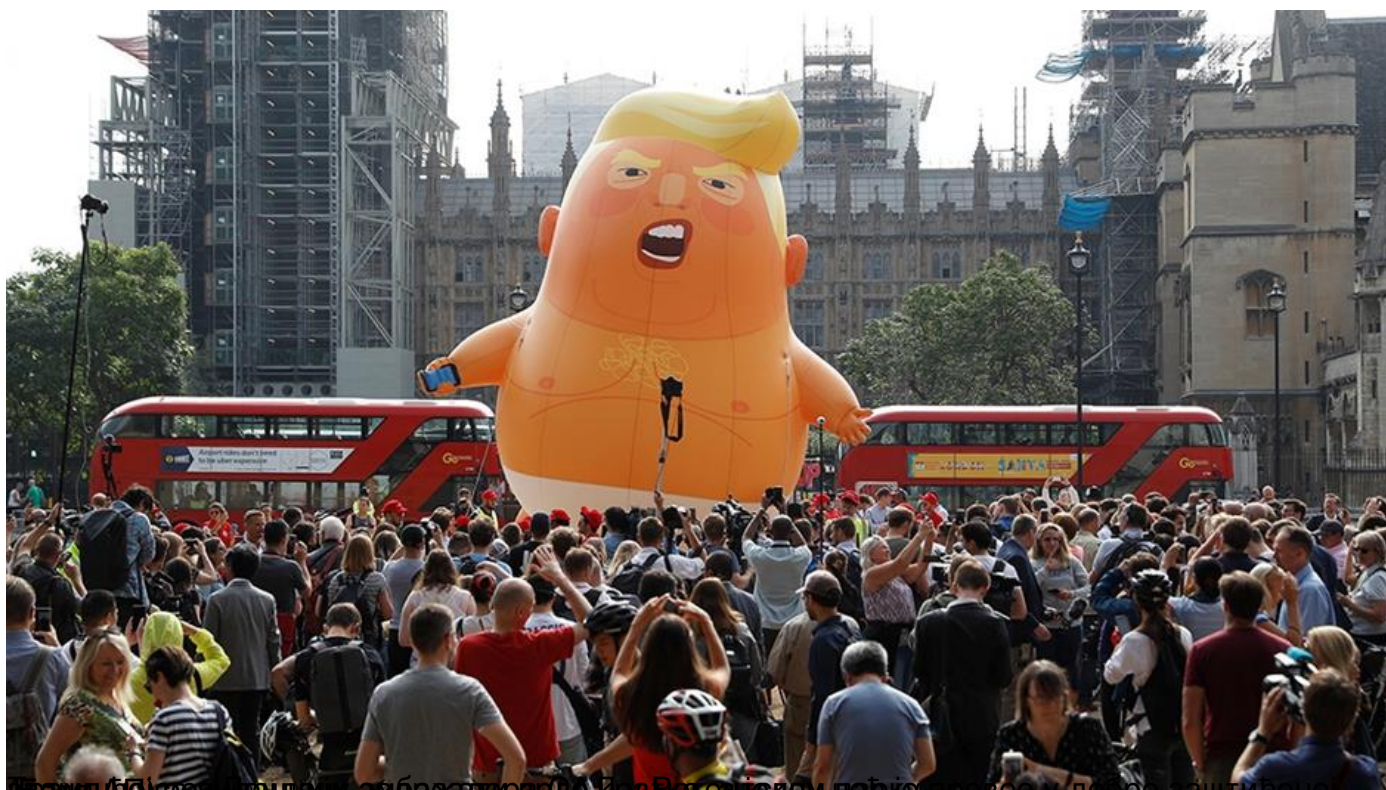
Франц Анжески доцнији амбасадор краља Ренеа је сваки парки провео у добро заштићеној