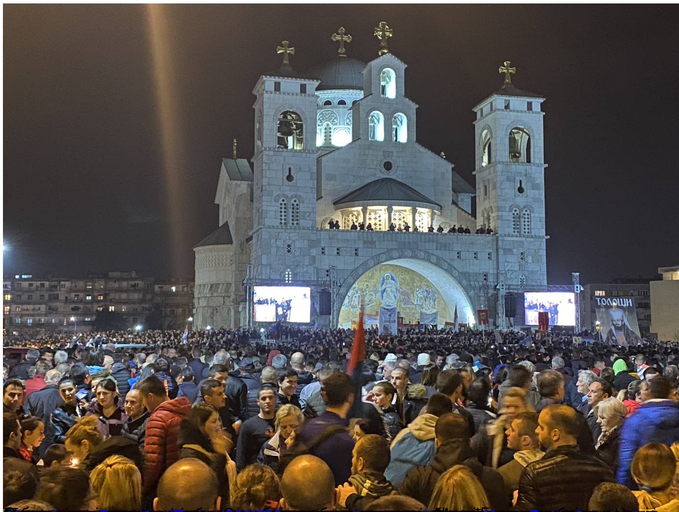
Мониторинг Српске Цркве и Српске Православне Цркве у Црној Гори