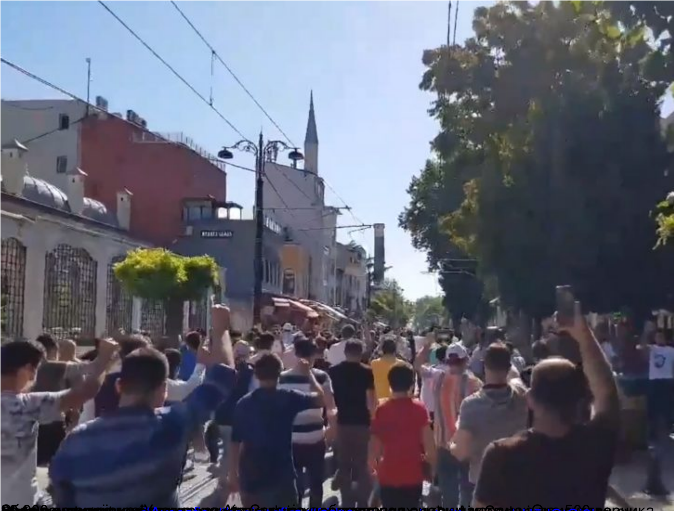
5000 турка испред Аја Софије на првој молитви након претварана у џамију