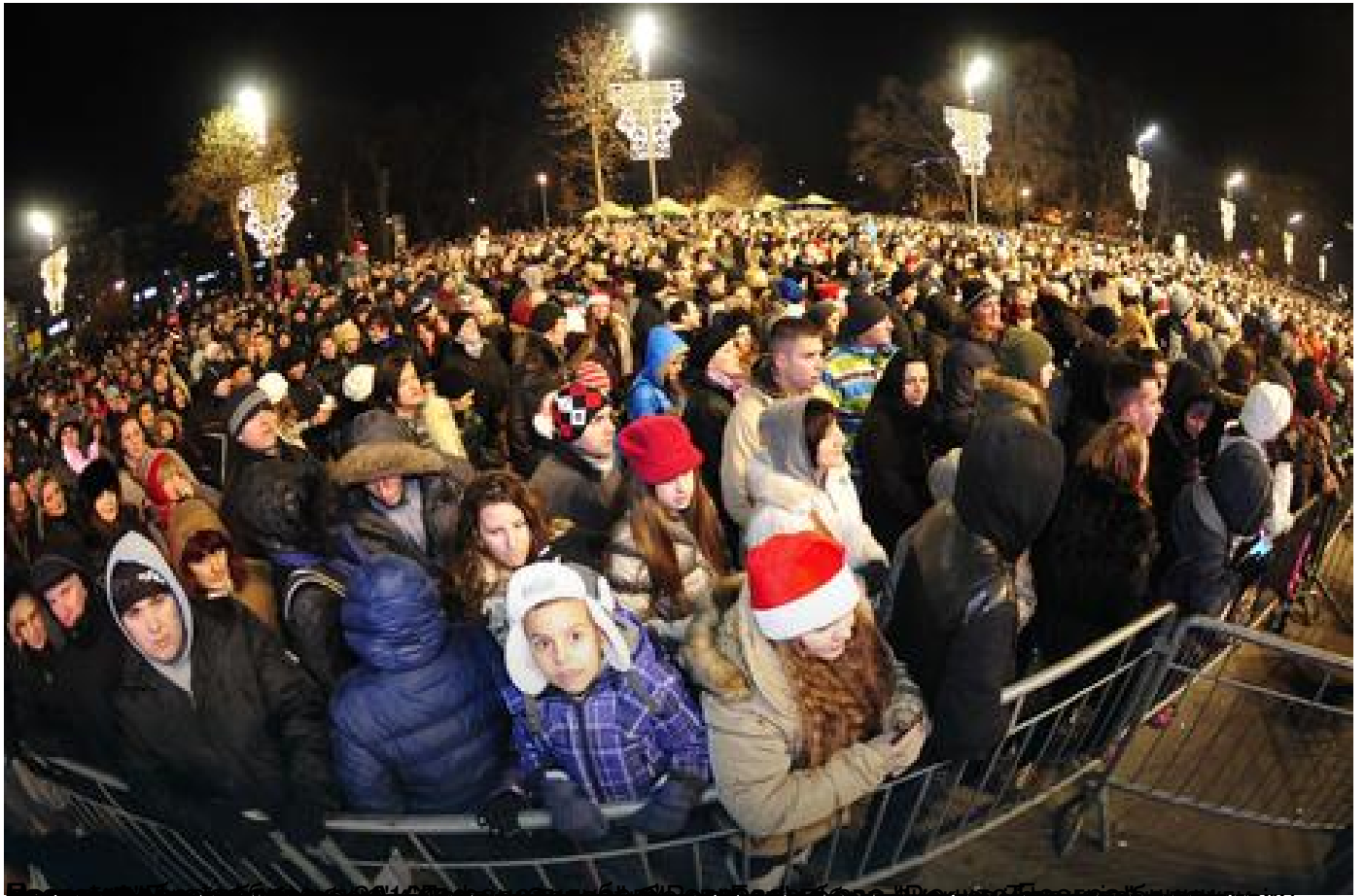
Испред Народне скупштине у Београду организован свечани дочек 2016. године, са бине упућена ч