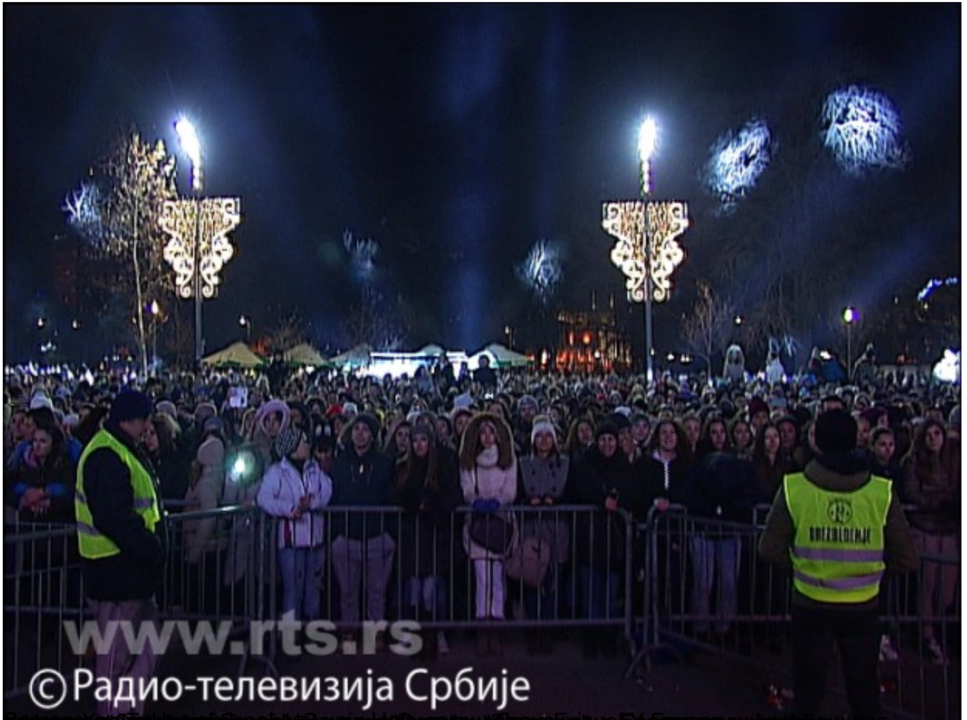
Испред Народне скупштине у Београду организован свечани дочек 2016. године, са бине упућена четвртак, 31 децембар 2015 21:01