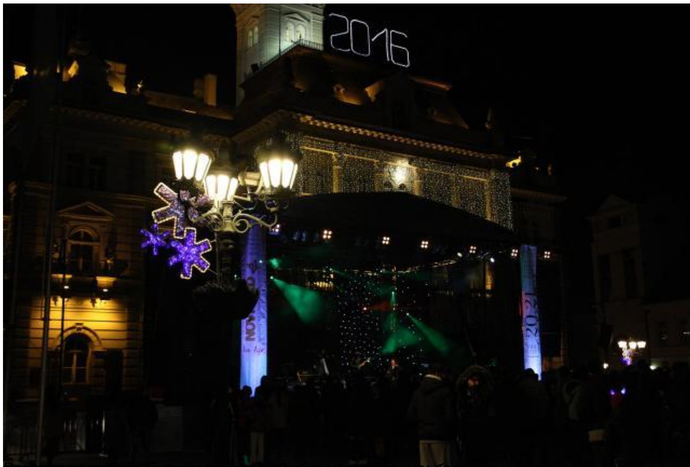
Испред Народне скупштине у Београду организован свечани дочек 2016. године, са бине упућена ч