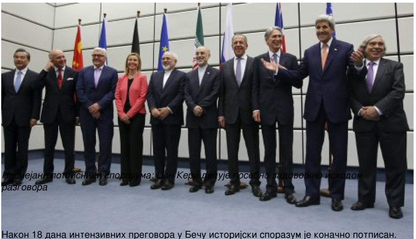
Насмејани потписници споразума: Џон Кери делује посебно задовољно исходом разговора

Република Иран и делегације шест светских сила (САД, Русија, Немачка, Велика Британија, Француска и Кина) постигли су договор о ограничавању спорног иранског нуклеарног програма, док ће тој земљи заузврат бити укинута санкције.