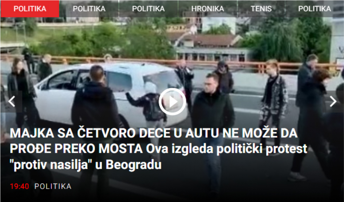
19:40 Politika: Majka sa četvoro dece u Beogradu, Beograd, 13. maj 2023. godine. U Beogradu, 13. maja, grupa ljudi blokirala je ulaz u tunel za vozila ka Novom Beogradu. Vozila