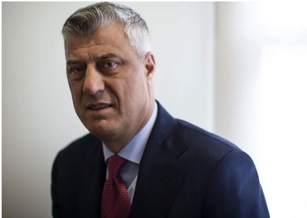
The president was head of the Kosovo Liberation Army in the Balkan wars

- Вучић је веома тешка особа за преговоре, да имате дијалог са њим - рекао је Тачи али