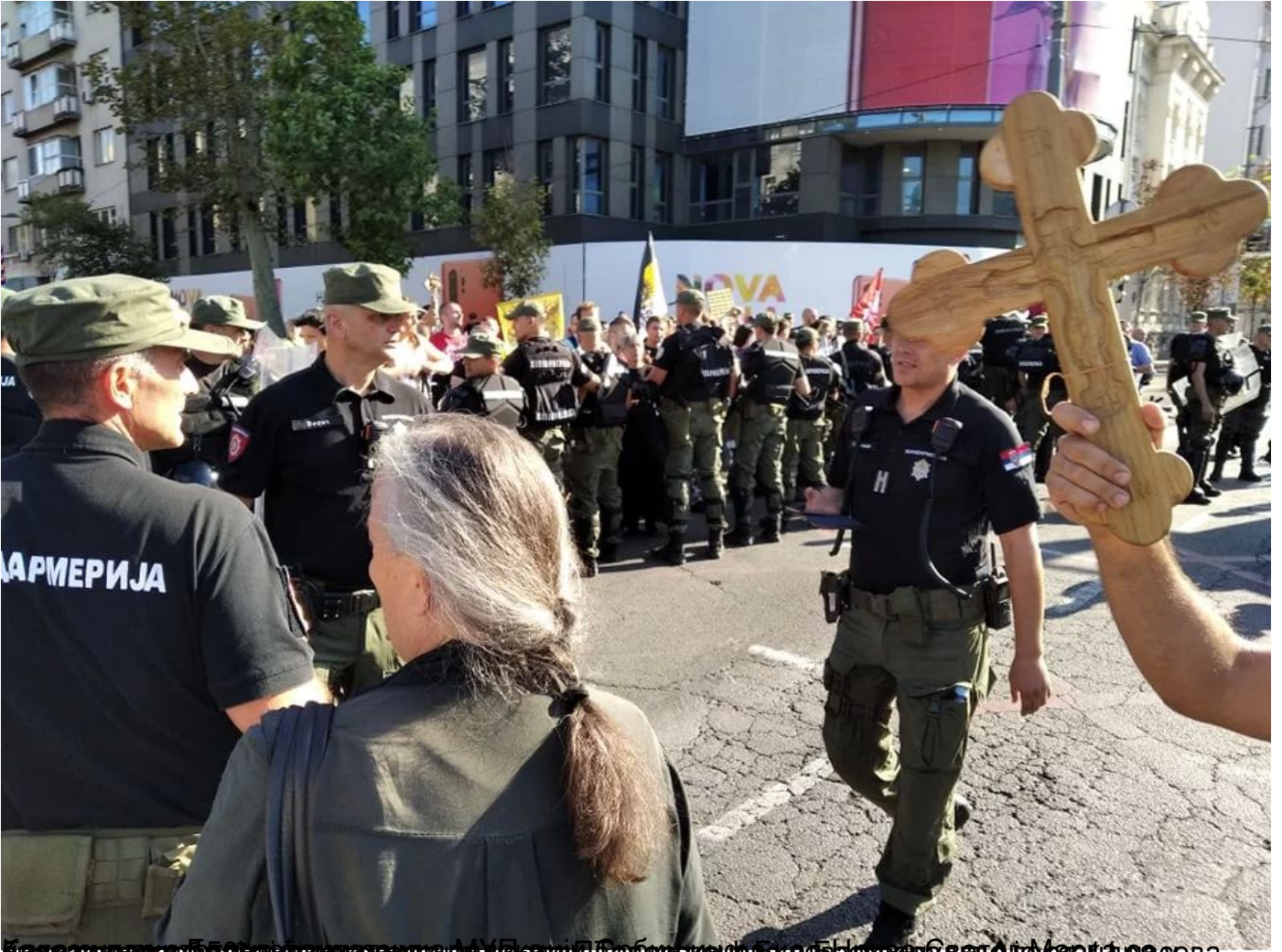
Београд, 15. септембар 2019. Група од око 150 људи протестује на углу Таковске и Булеvara краља Александра у знак протеста.