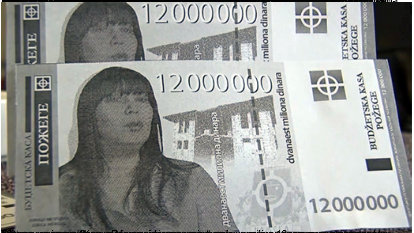
Грађани Пожеге протестовали због одлуке локалне СНС власти да за 12 милиона динара купи плац