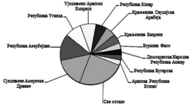
Графикон број 6.1.: ИЗВОЗ-не дестинације НВО (према реализацији)