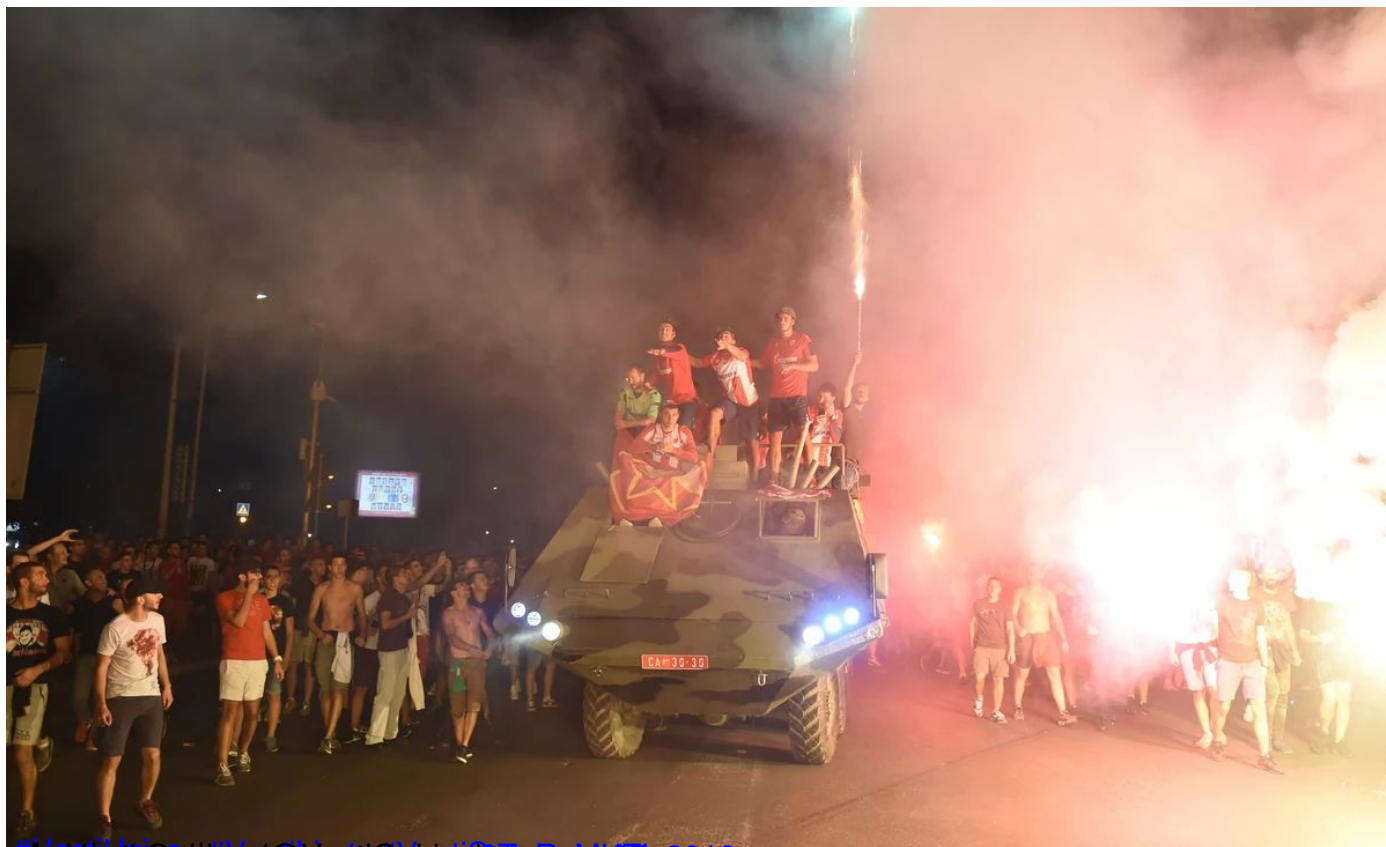
#ArmedFan @VestiOnline 28 Avgust 2019