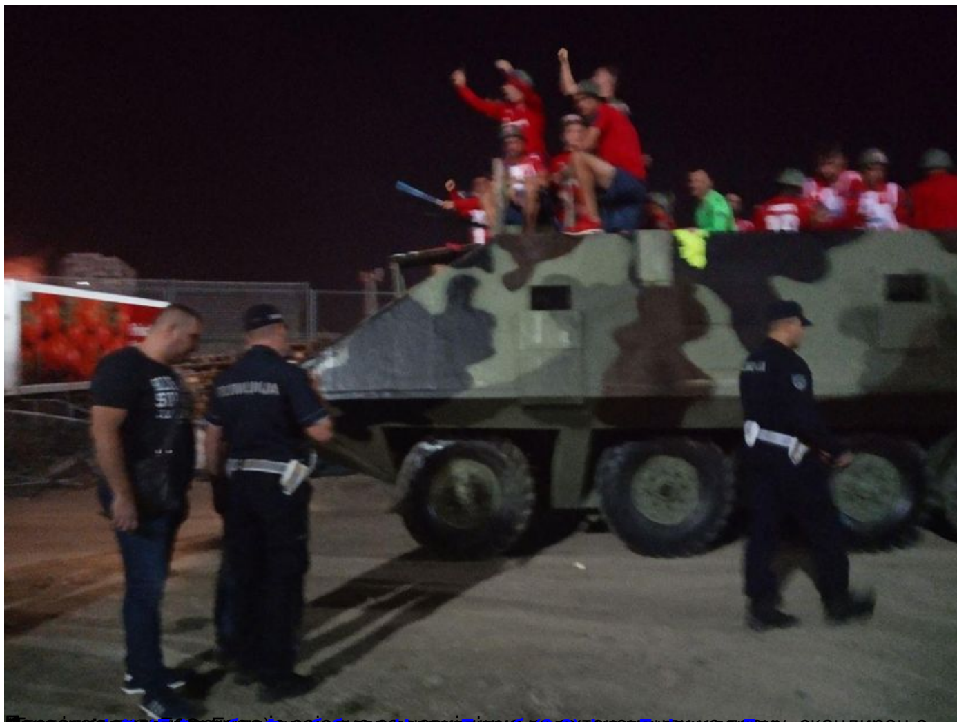
Фудбалери Црвене звезде „наоружани“ бакљама и шлемовима, у оклопном возилу са транспарентом