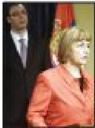
Enkelti odgovorili su na pitanje o EU, kao i o pitanjima vezanim za Srbiju, kao i o pitanjima vezanim za Srbiju