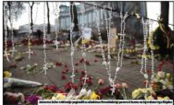
U Beogradu se održavaju pogrebni obredi za žrtve terorističkog napada iz aprila prošle godine

U Kijivu traže odgovornost za „masovno ubistvo civila“