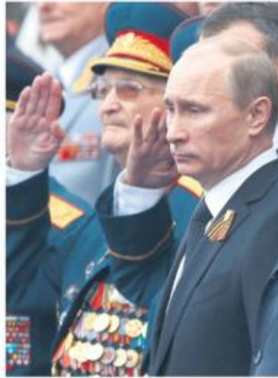
Владимир Путин на војној паради у Москви

Председник Русије ће присуствовати обележавању 70. годишњице ослобођења Београда и победе над фашизмом, поручио је премијер Вучић