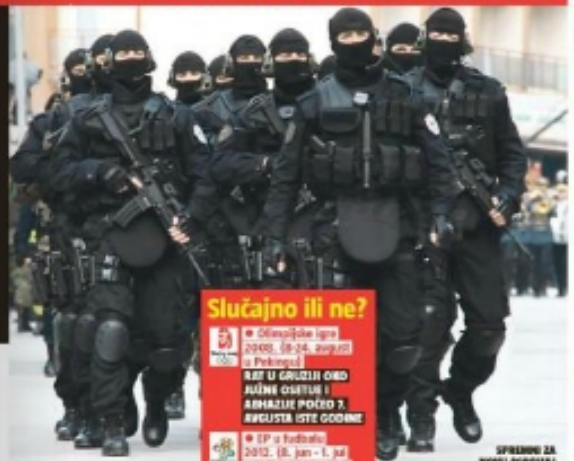
SPREMI ZA NOVU AKCIJU