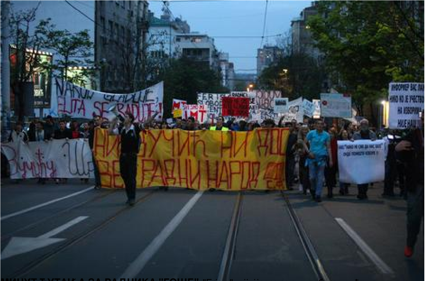
МИНУТ ТУТАК А ЗА РАДНИКА "ГОШЕ" "БЕ ПРЕДАЈЕ!"