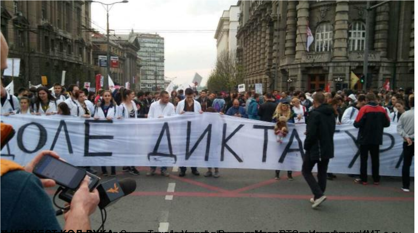
Демонстранти који држе бану са лозунгом "Против диктатуре" у улици Булеваре Слободе у Београду.