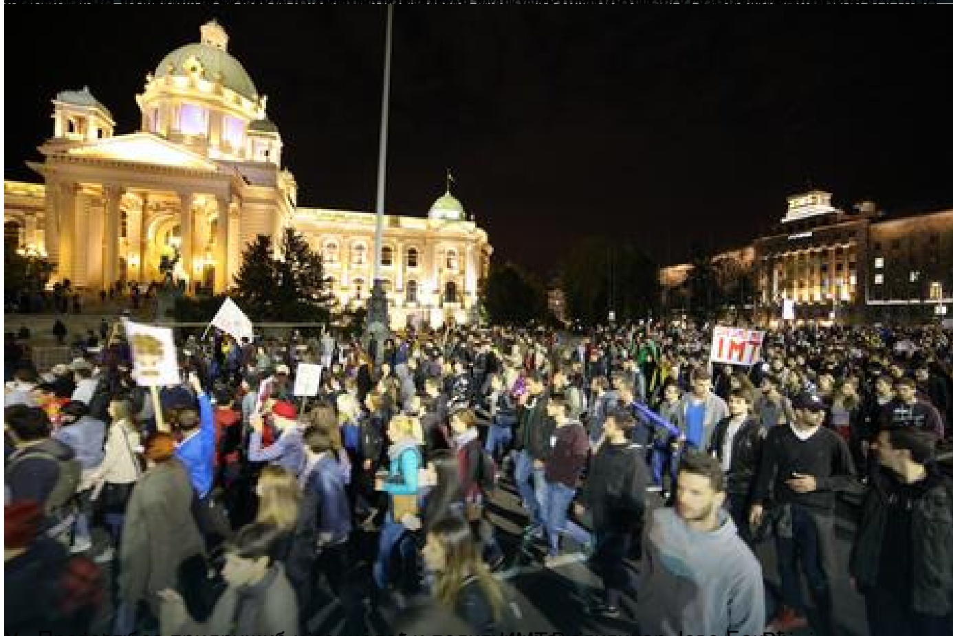
Видео снимак са протеста, објављен на сајту Републичког медијског центра Србије, 11. априла 2017. године.