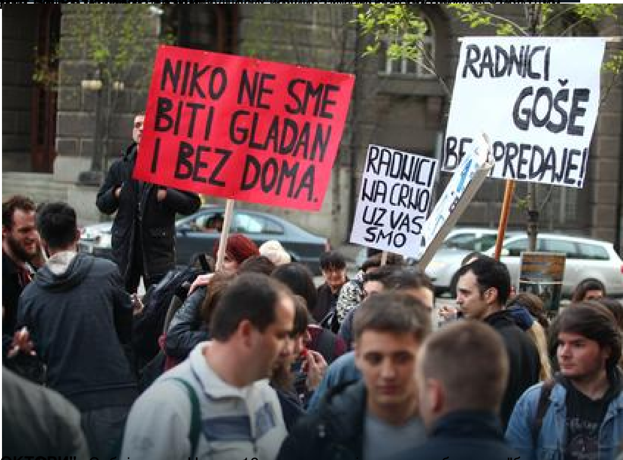
РАДНИЦЕ ИМ ДОДЈЕЛИ СРБИЈЕ РЕАЛНОСТ НА СТРАНИ СТАРЕЊИМА ЈЕРИ ЛИ СУ ВА БИЛИ ДА ЗАБРАВО