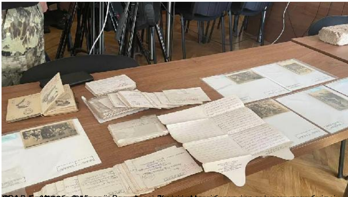
Пронађен оригинални списак Дијане Будисављевић са 5.800 имена српске деце спас