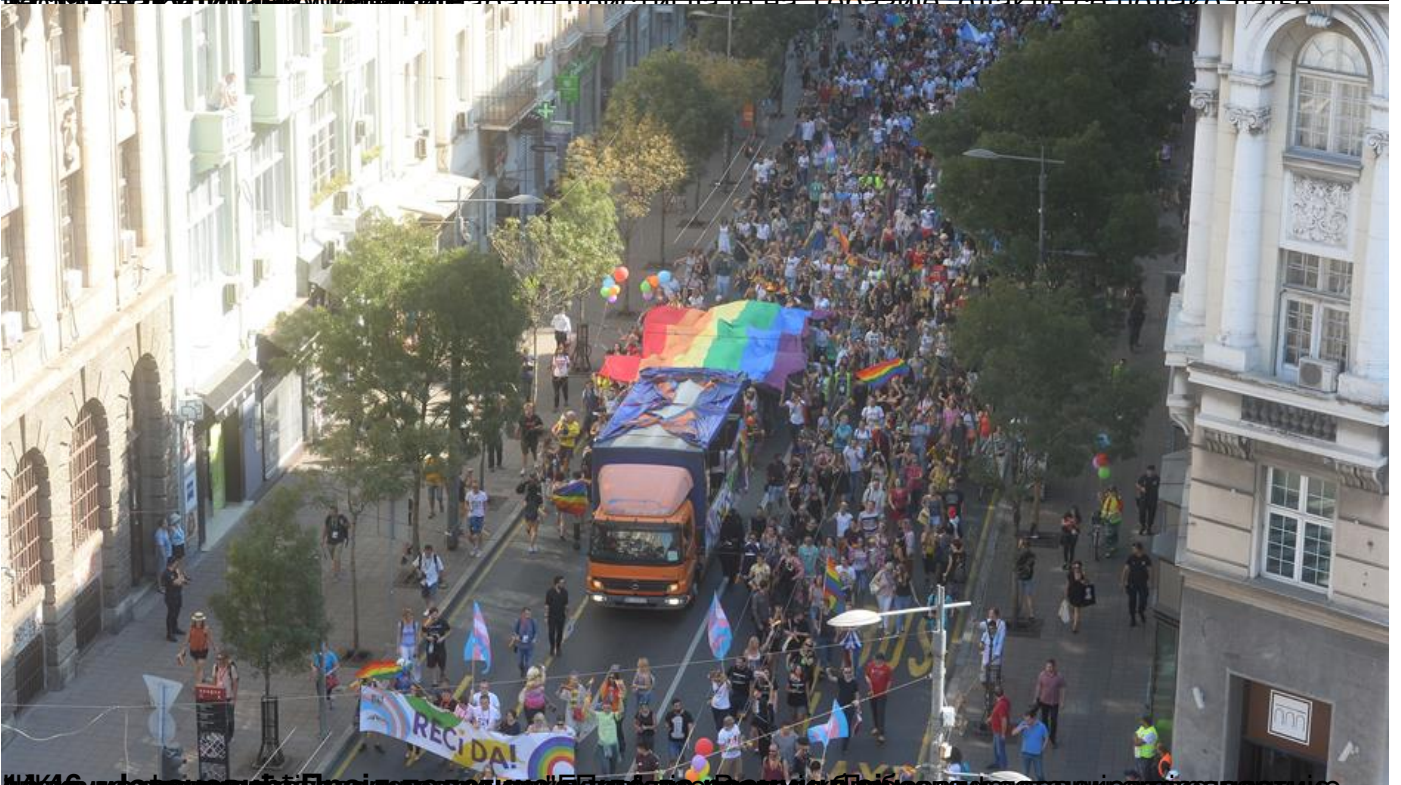
14:16 - избухнуло у ватру, Парада се одржала "Београд" у Радничкој, а не у Београдској, где је она и