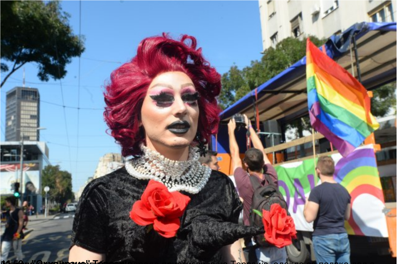
14:59 - "Оригинале" Теразијама, где је парадантима изашао на Терезије, одакле се долази ка