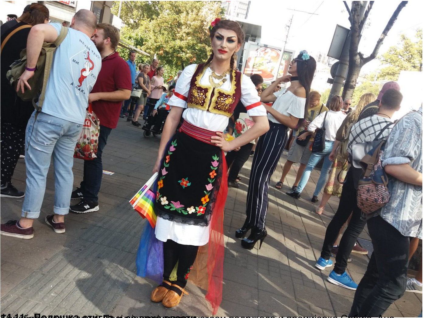
14.16.16. Белград, 16. септембар 2018. Парада поноса у центру Београда, учесник у традиционалној српској народној ношњи са заставом поноса.