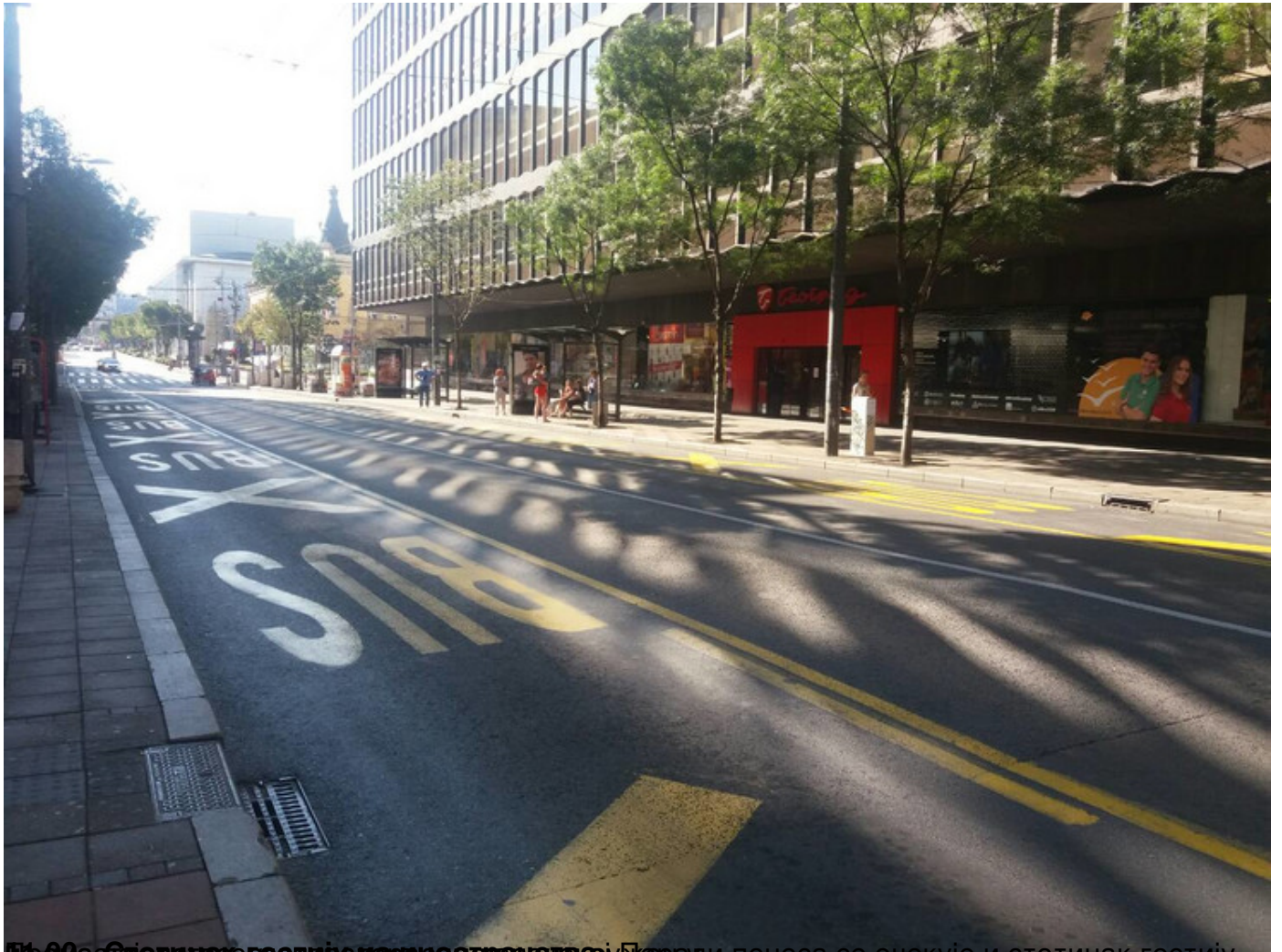
19:00 - Сајам на раскрсју из централног јавног простора у Београду