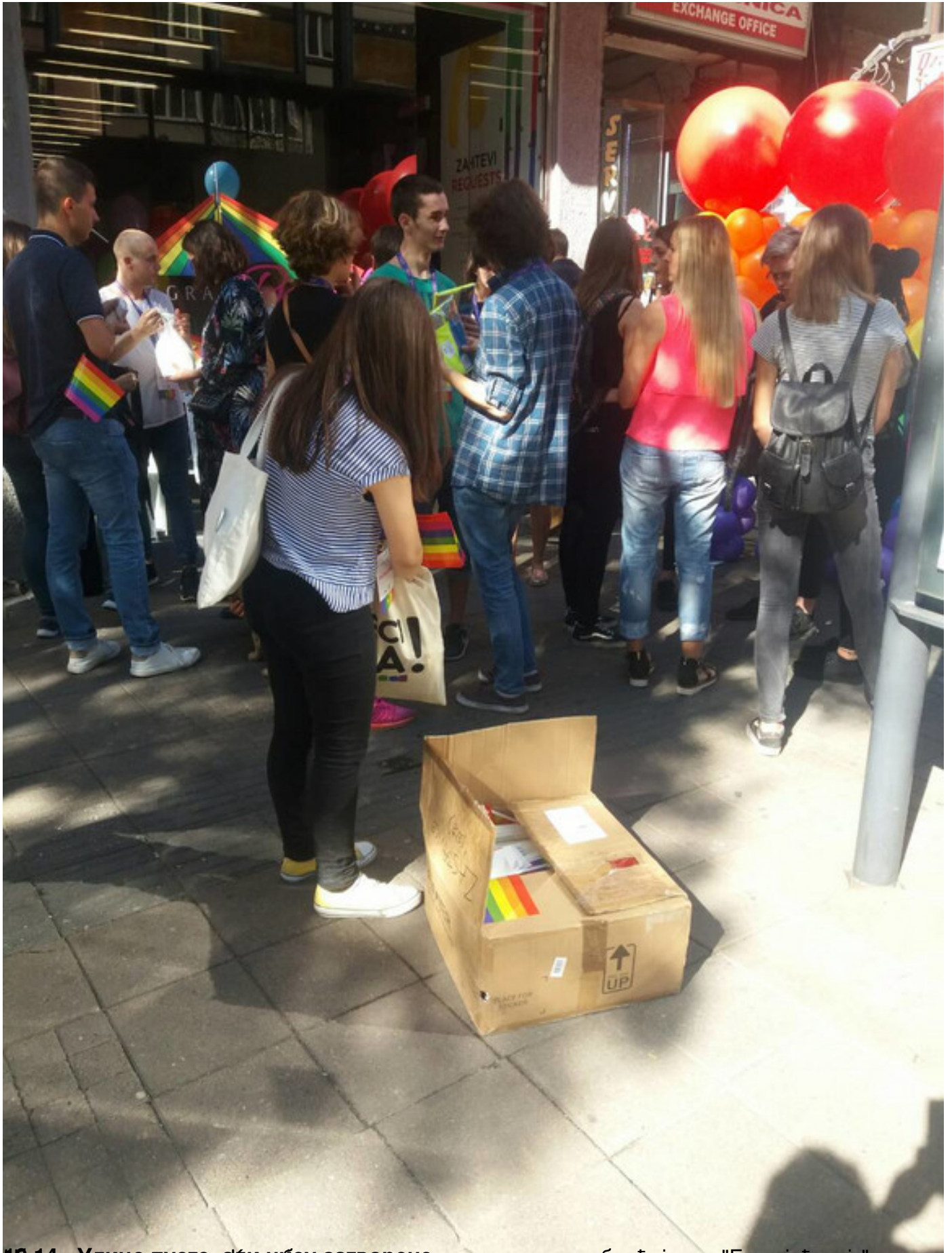
16. септембар 2018. Улица Дулеза у Београду се отвара по први пут са лица обраћајућим "Београђанима"