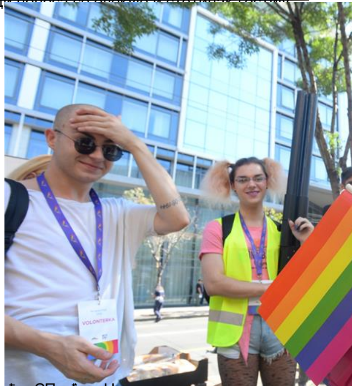
19:40 - Организација сајма на раскрсју из централног јавног простора у Београду. Организација је привремено блокирала то смо