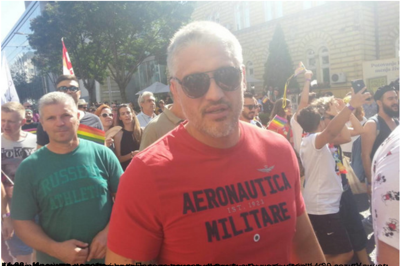
Неколико стотина учесника "Параде поноса" прошетало центром Београда, који је био у блокади о недеља, 16 септембар 2018 10:06