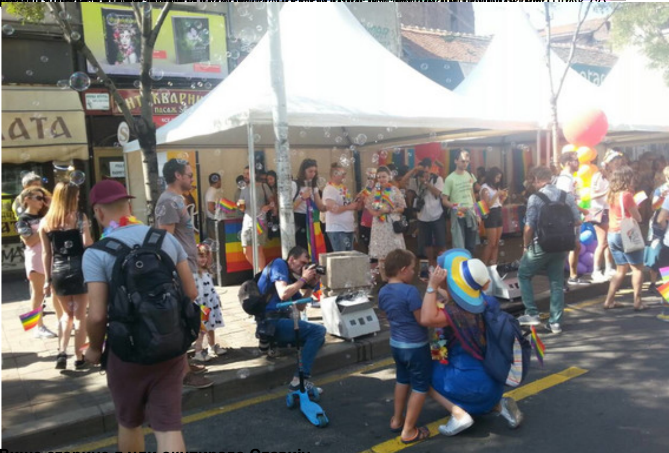
12.59 - Више сторине људи окупирао Славију