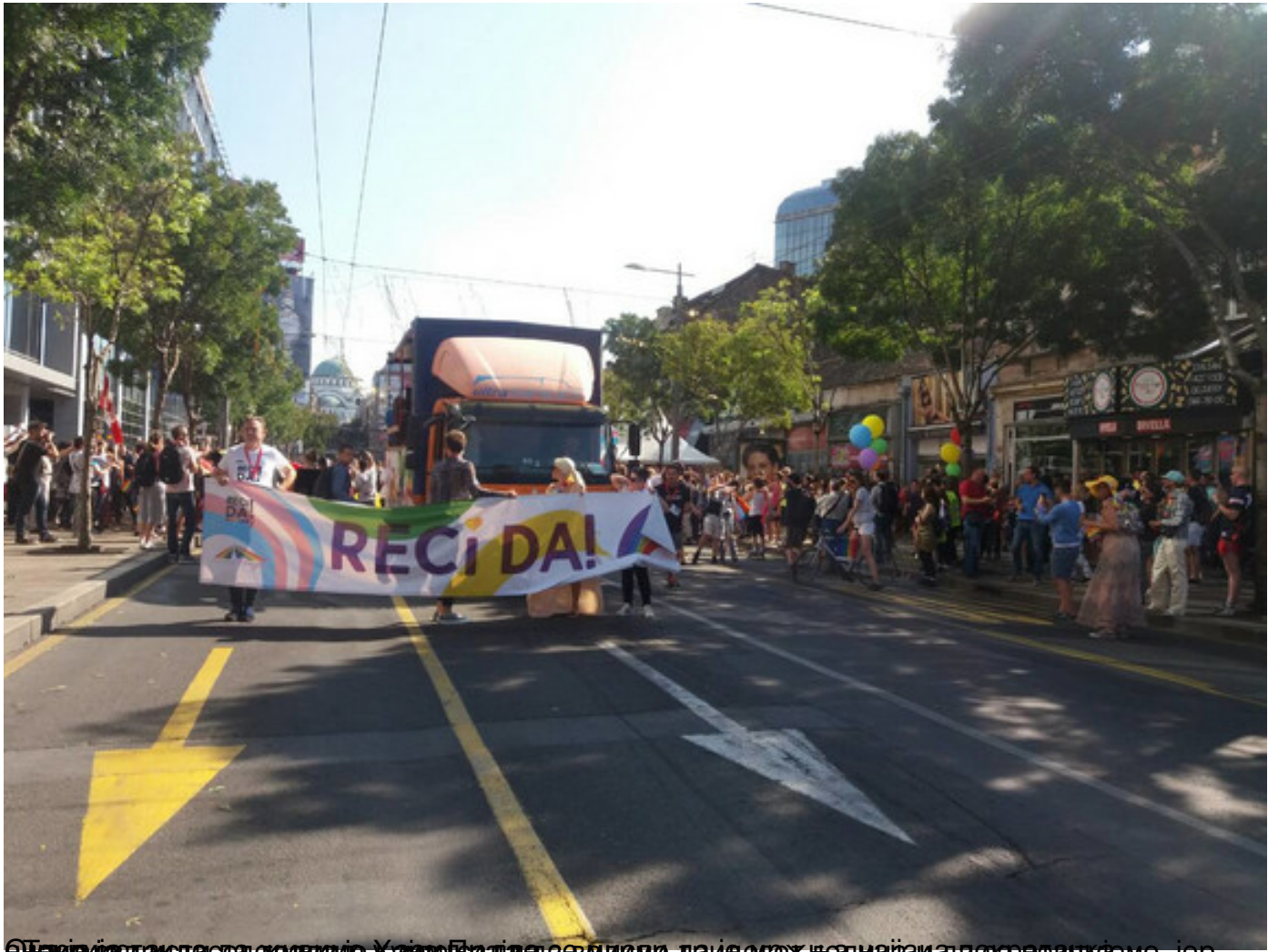
Благије је гласила од оца и маје Хајде Брајда да волимо да је до се жњаднајаи да се рванујемо, јер