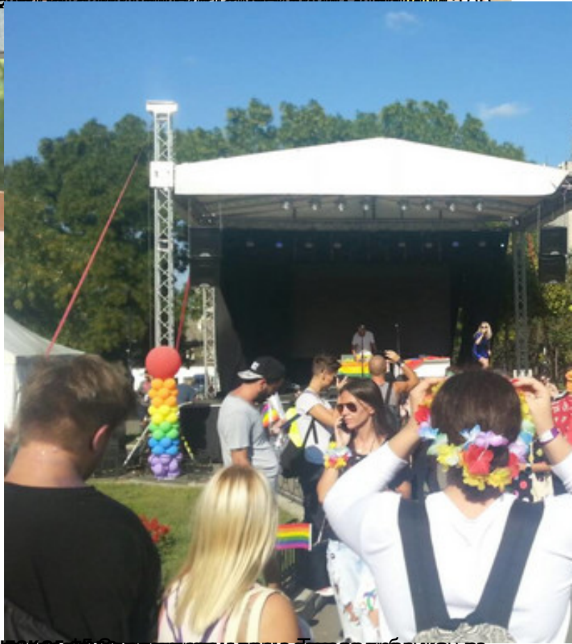
615-16. Прва учесница стигла до Стуба Београда. Удвинула се према сцену са сексуално оријентацијом