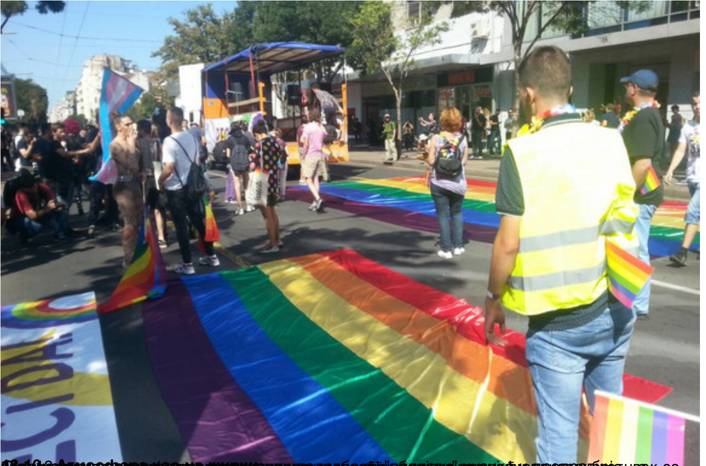
12.16 - Амбасадна црква је била у блокади