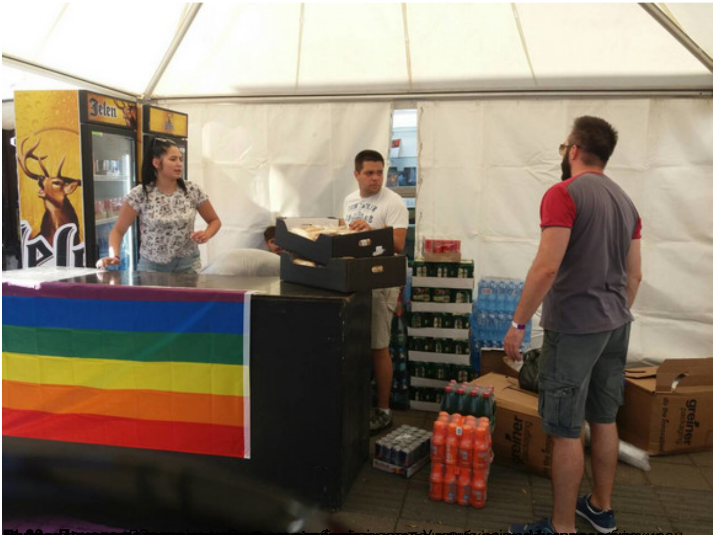
На 00. Пиво и пица у Београду, у организацији организације "Ушће", на паради поноса у Београду