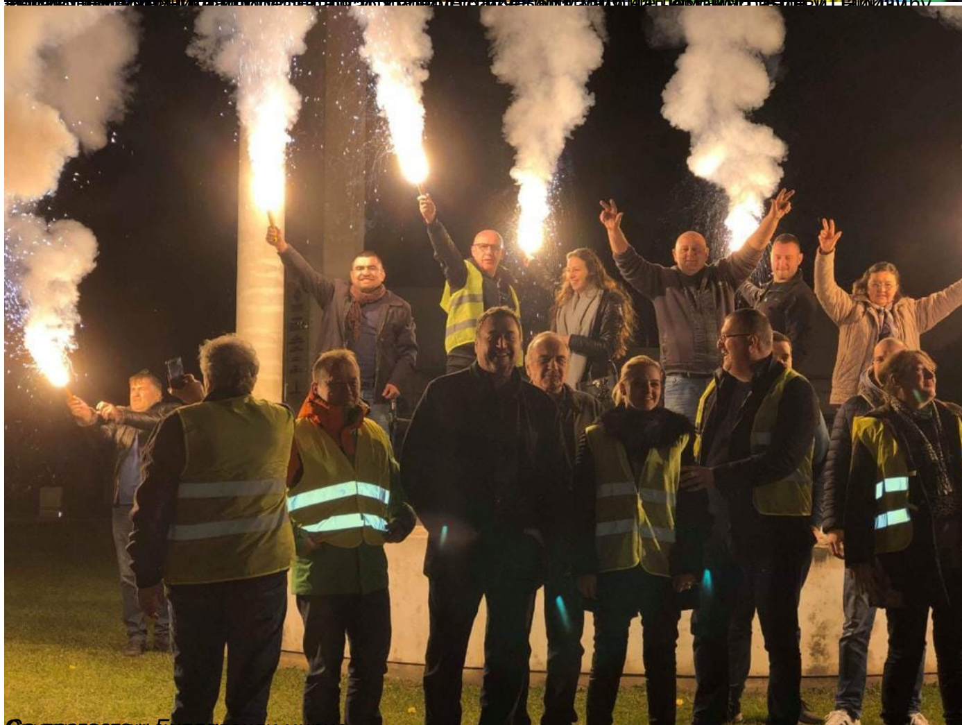
Са протеста у Будви текли мирно.