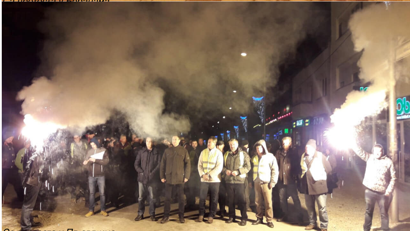
Са протеста у Пљевљима