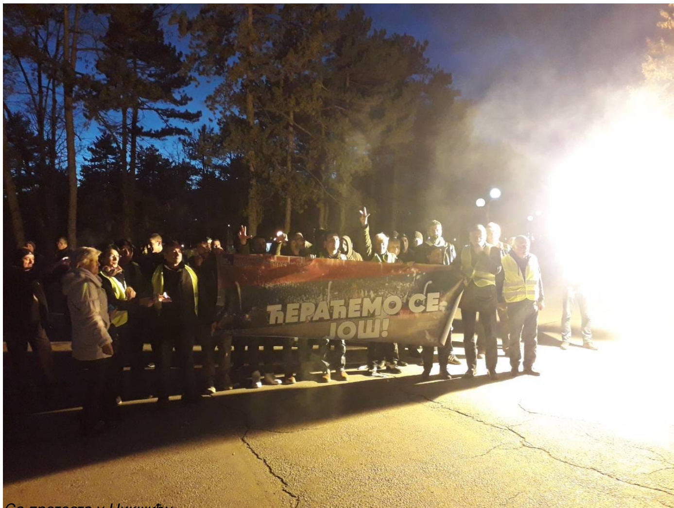
Са протеста у Никшићу