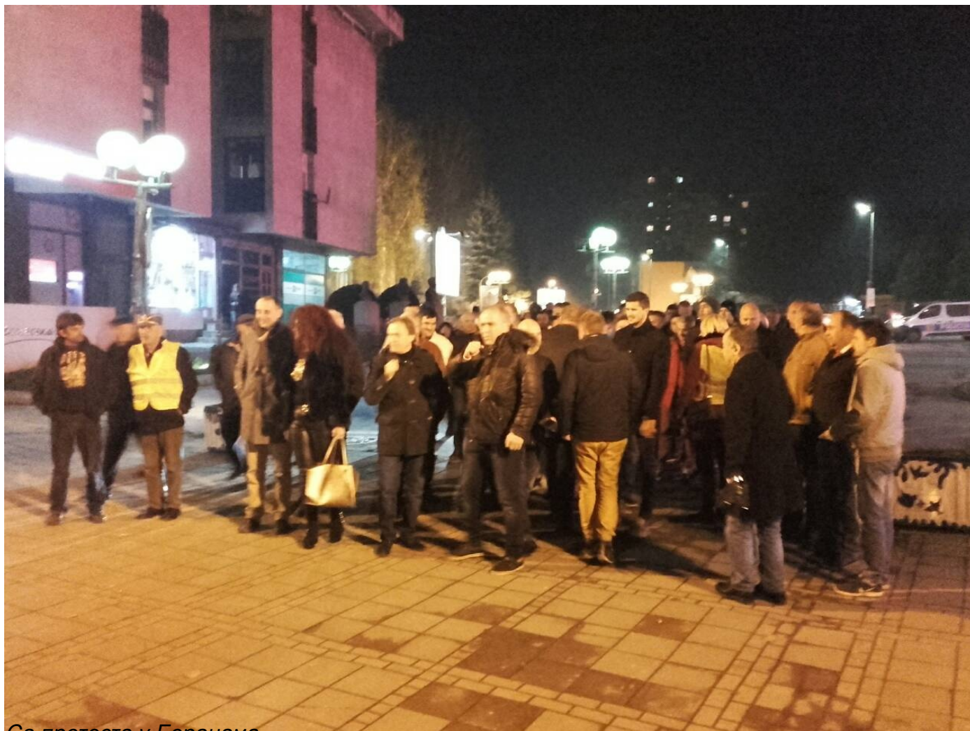
Са протеста у Беранама