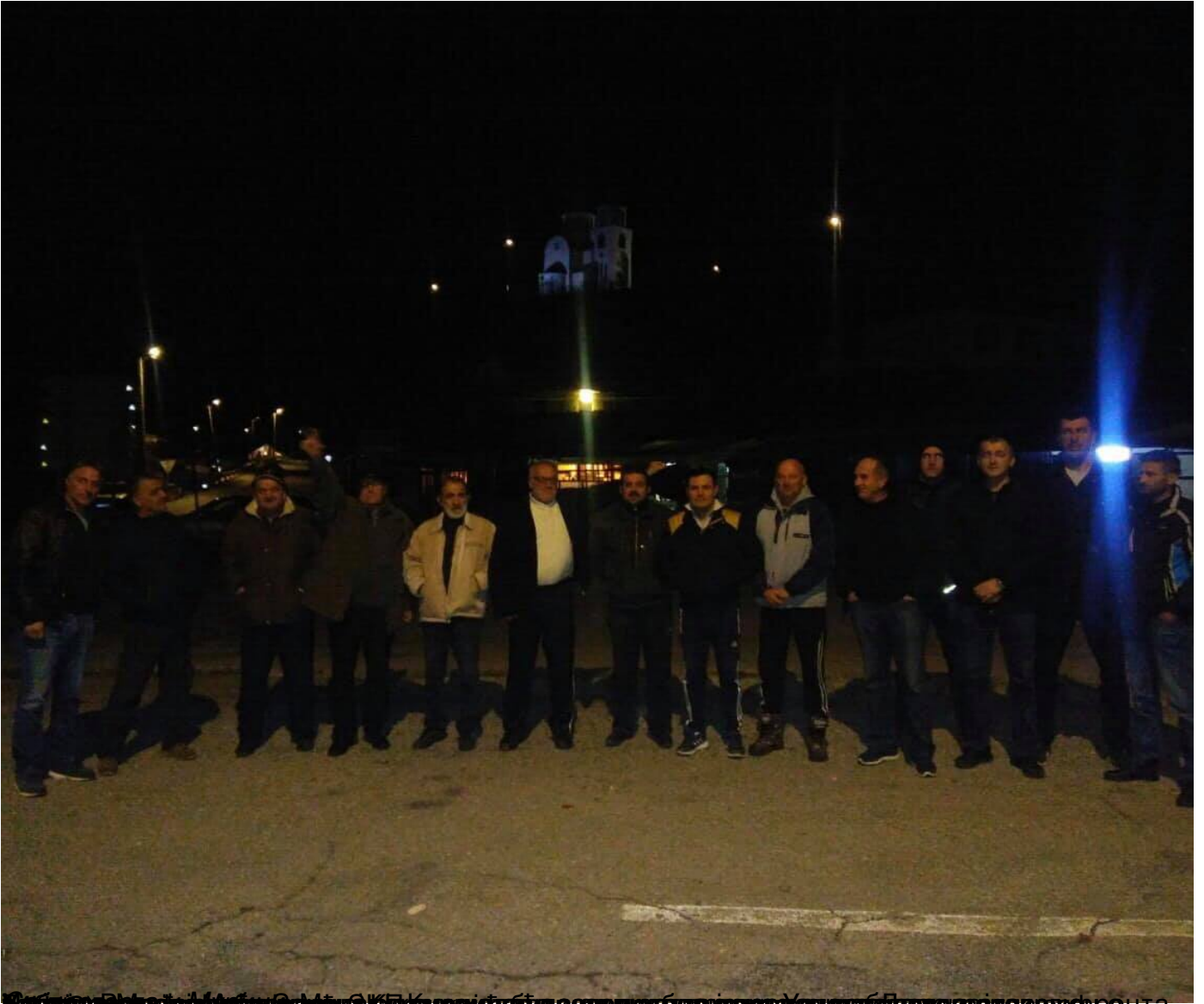
Учесници протеста Демократског фронта у Подгорици, Беранама, Пљевљима, Будви, Н