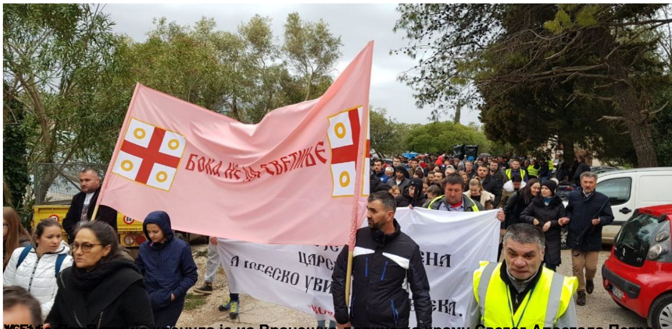
УБИјелорваољула кренула је из Вранешке долине ка храму Светог Апостола Петра