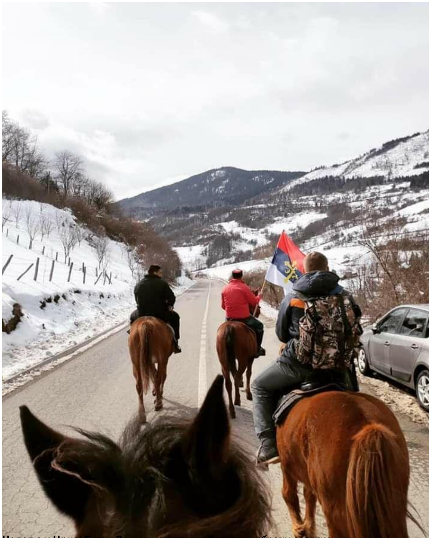
Недеља у Црној Гори. Дан за молитву, сабрање и одбрану светиња.