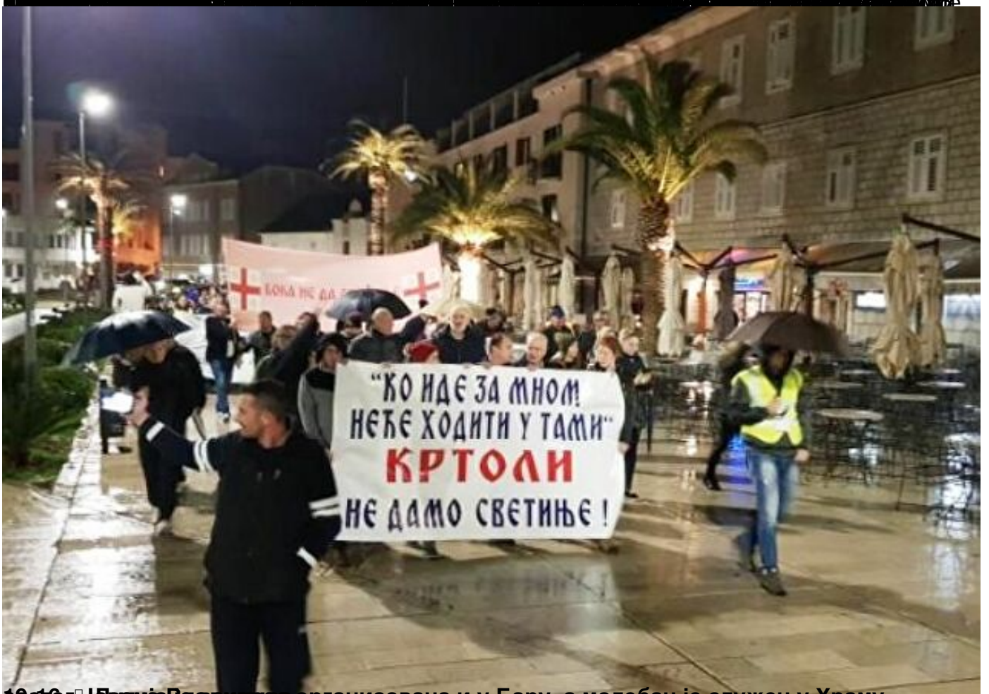
Светог Јована Вазнића организована и у Бару, а молебан је служен у Храму