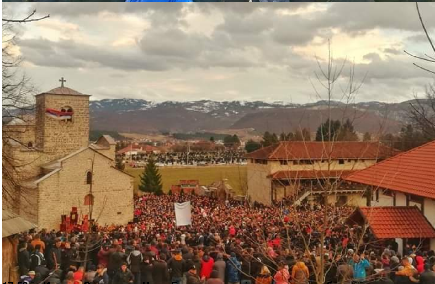
17:58 - Испред Скупштине Црне Горе одржана је молитва за одбрану светиња