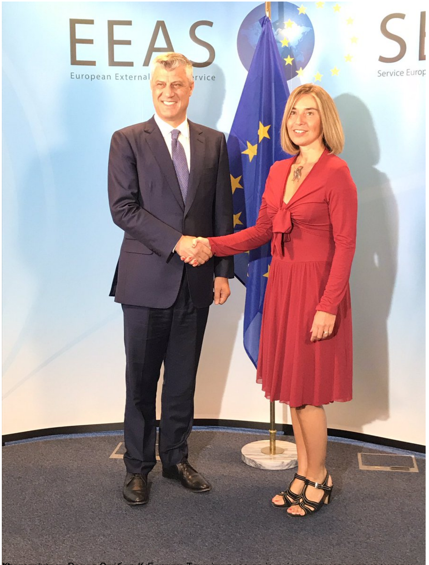
Како поручи Радла Служба на сврху на Јединство навео да је дијалог државни приоритет и