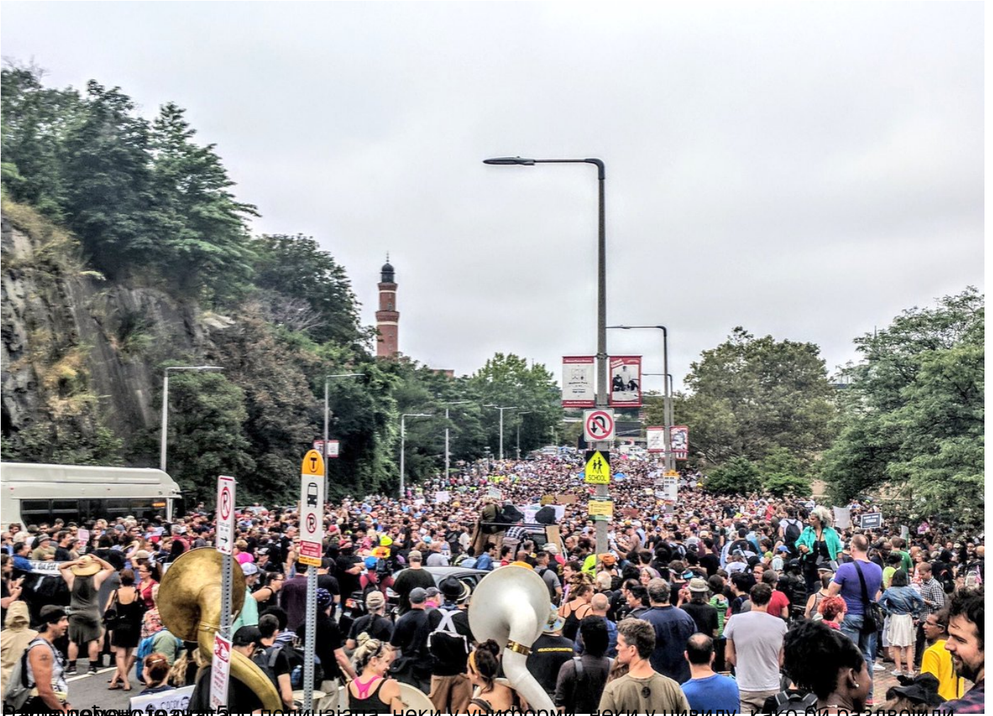
Напољу дејство је ажабо полицајаца, неки у униформи, неки у цивилу, како би раздвојили