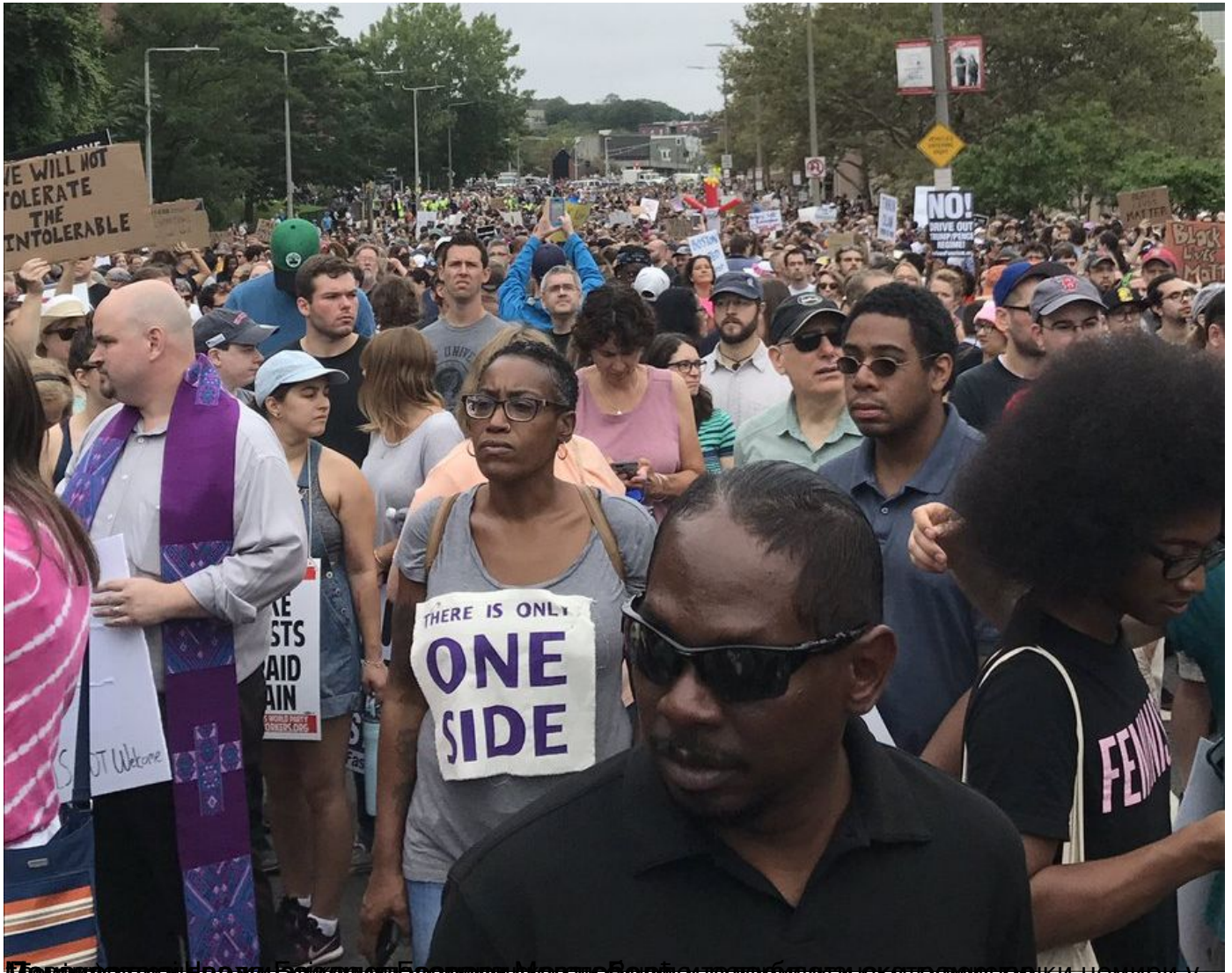
Митинг у сали града Њајквил, Бостон, Масачусетс, против десничарског скупа за „Слободу говора“ недељу дана