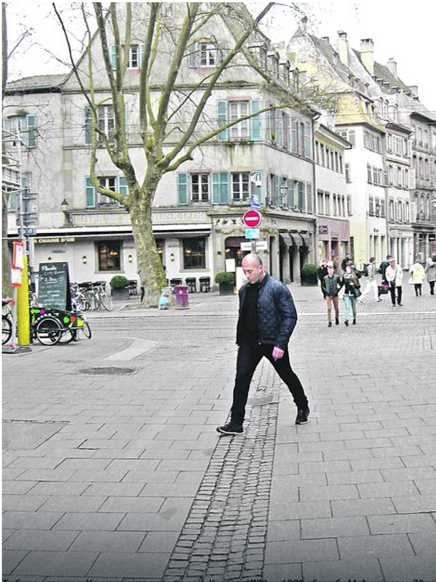
Будилашћесва ојнавапојие а оета а даје Кисе сву 866 алд 1988 а бдијеи Мџајравал 70