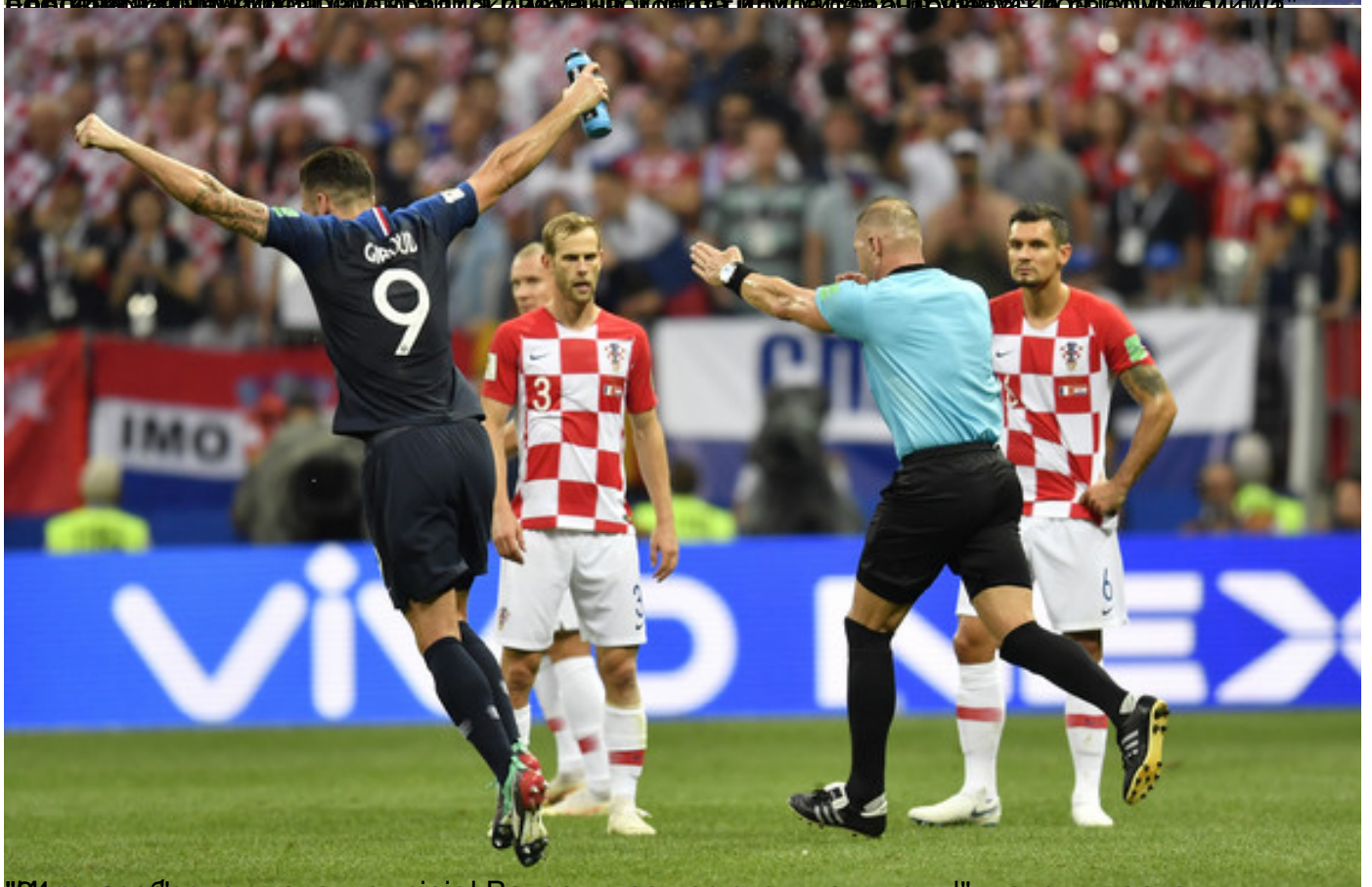
"Златно сребро, али златног сјаја! Ватрени, за нас сте - шампиони!", наводи портал