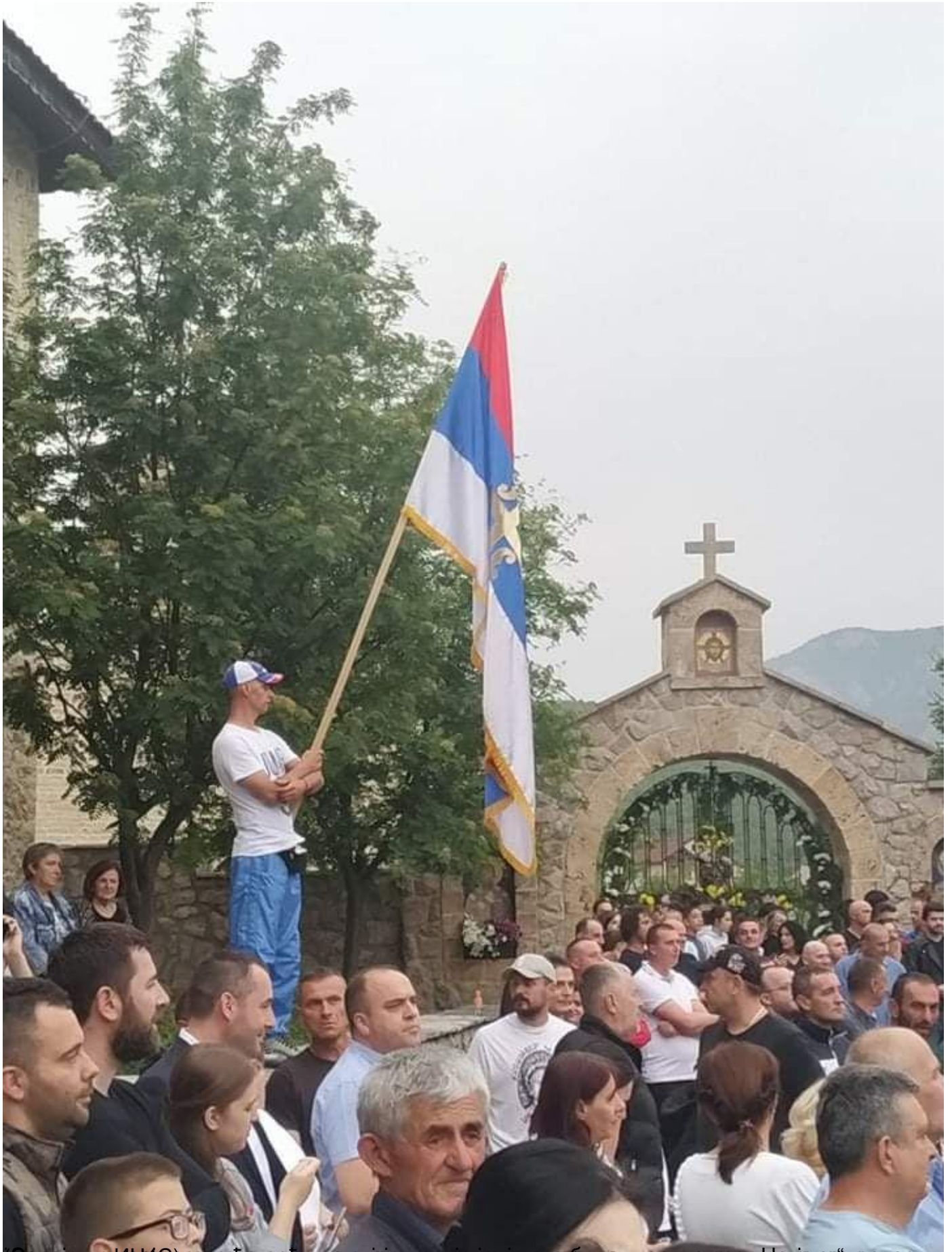
Беране, 17 маја. Велики број грађана дочекао владика Јоаникија у манастиру Ћурђеви ступови, орило се „Ж