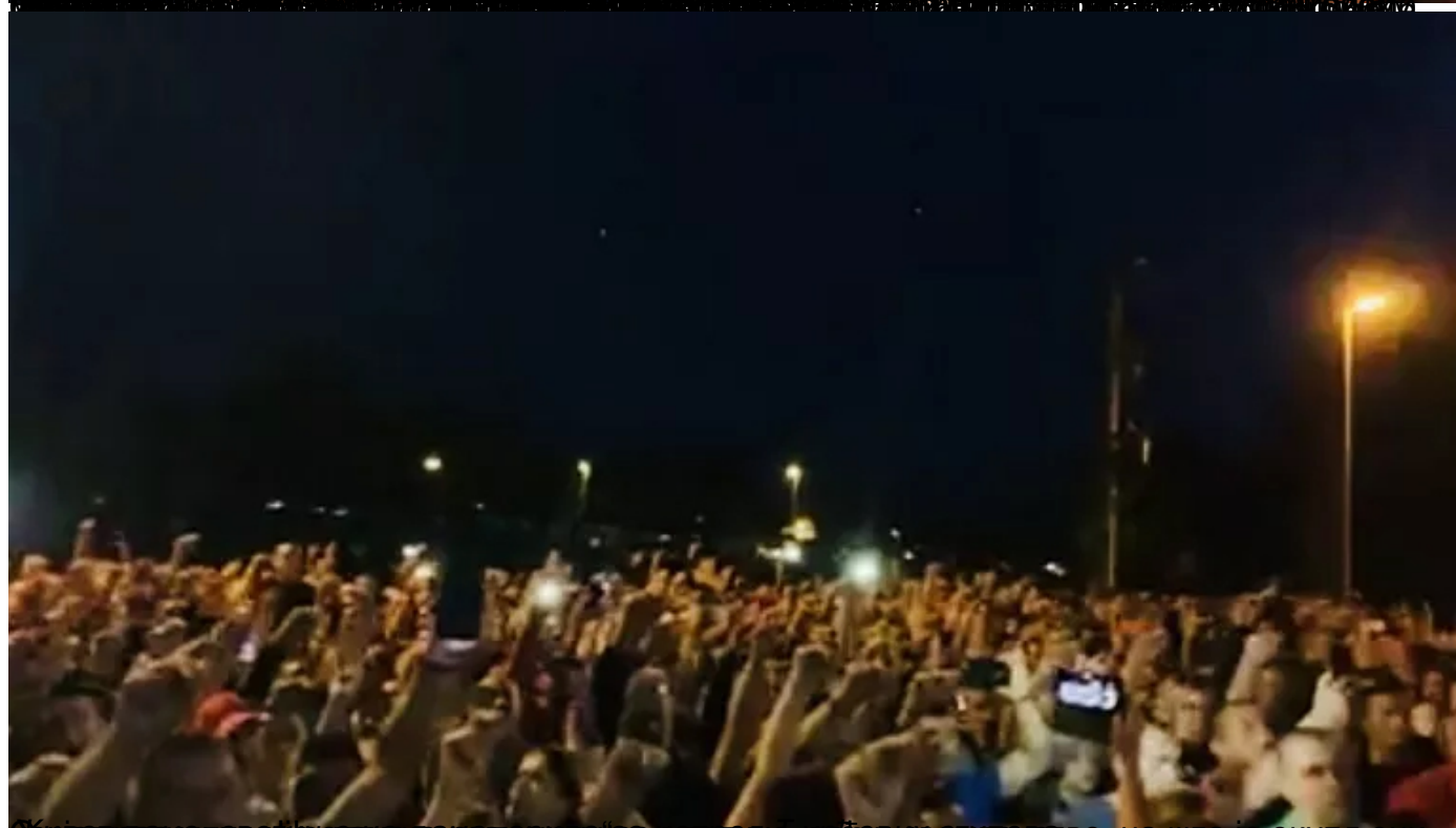
Број грађана који су дошли да дочекају владика Јоаникија у манастиру Ђурђеви ступови, орило се „Ж недеља, 17 мај 2020 23:04