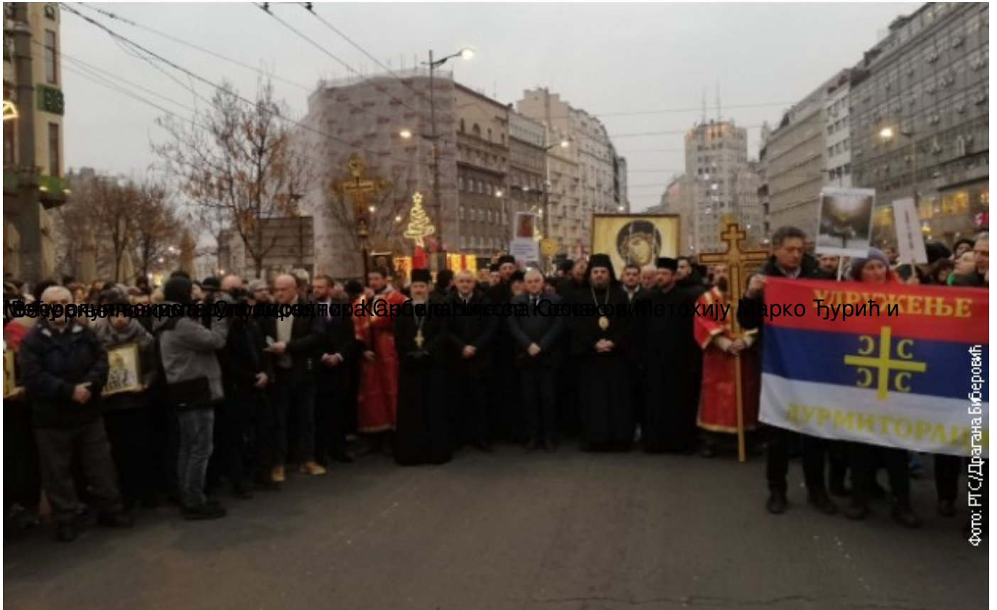
Београд: Више од 10 хиљада грађана на литији поводом подршке очувању светиња СПЦ у Црној Гори