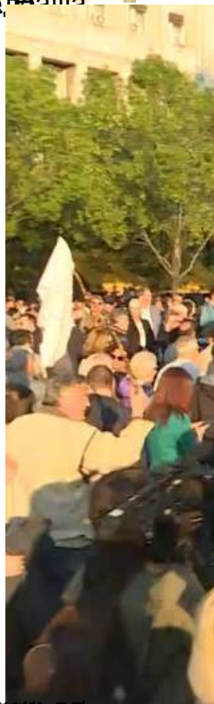
Београд: Неколико десетина хиљада грађана на протесту "Један од пет милиона - Сви као један", субота, 20 април 2019 17:24