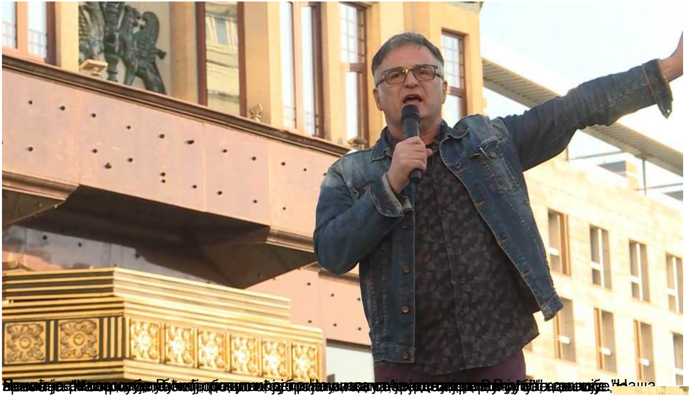
Београд: Неколико десетина хиљада грађана на протесту "Један од пет милиона - Сви као један", субота, 20 април 2019 17:24