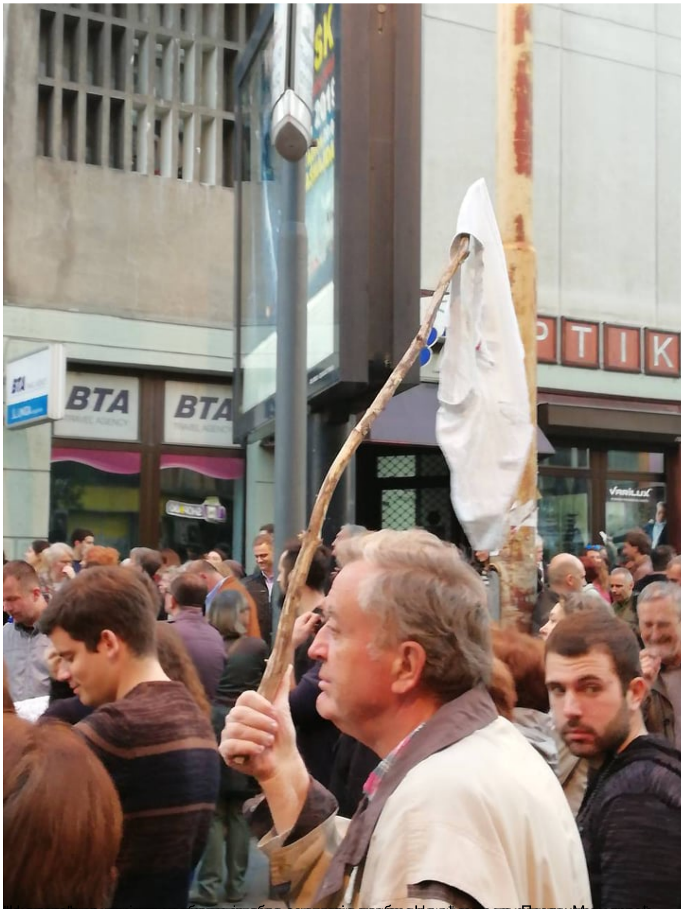
Датум: 20.04.2019. 17:24. Место: Београд. Опис: Један од пет милиона - Сви као један