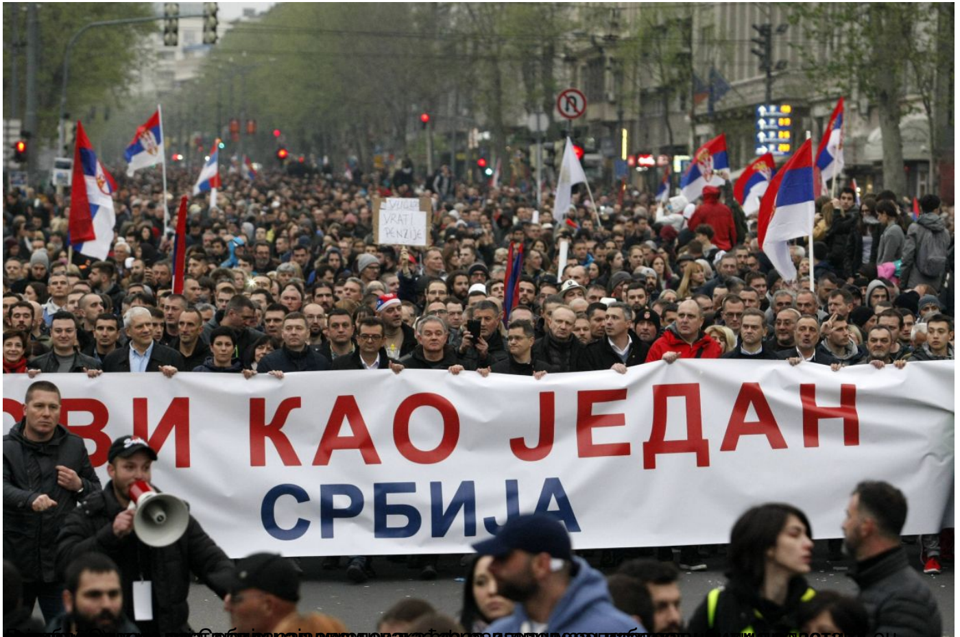
Београд, 20. април 2019. године. Протест "Један од пет милиона - Сви као један" у Београду. На слици је видљива велика група грађана који држе заједнички транспарант са српском заставом и лозунгом "Сви као један Србија".