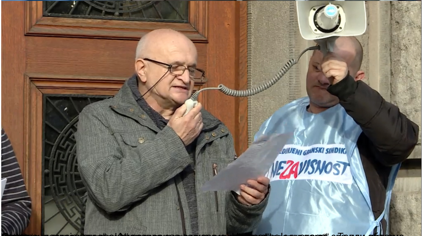
Слика је из архиве портала Београдски металаци и не може бити објављена у овом медијуму. Све остале слике су снимљене