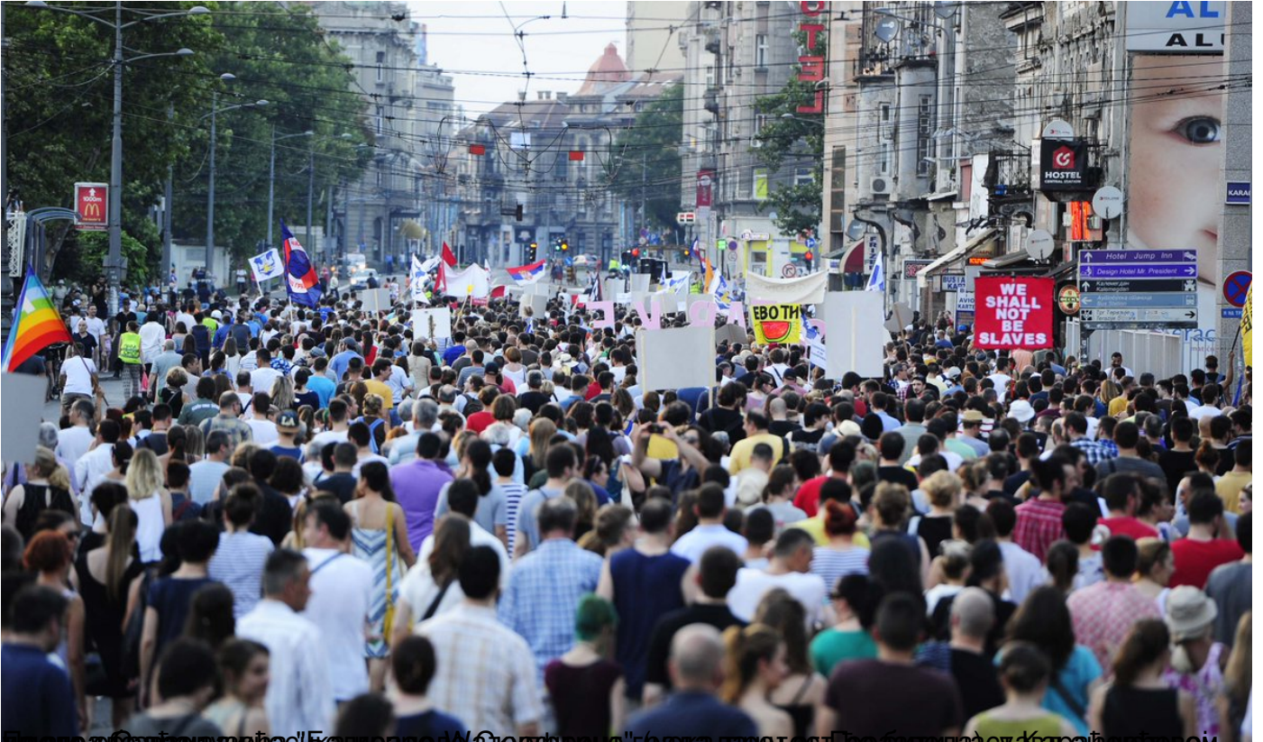
Десетак хиљада грађана по пети пут у протестној шетњи због рушења објеката у Савамали