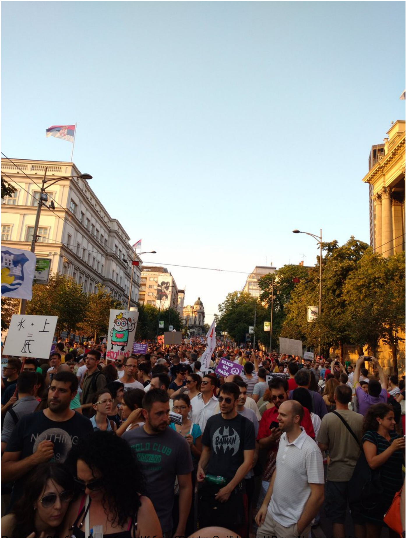
Београд: Десетак хиљада грађана по пети пут у протестној шетњи због рушена објеката у Савамали