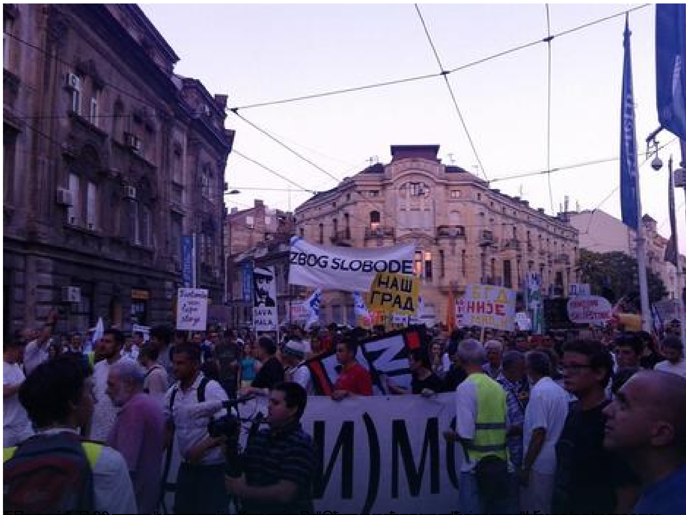
Београд: Десетак хиљада грађана по пети пут у протестној шетњи због рушења објеката у Савамали