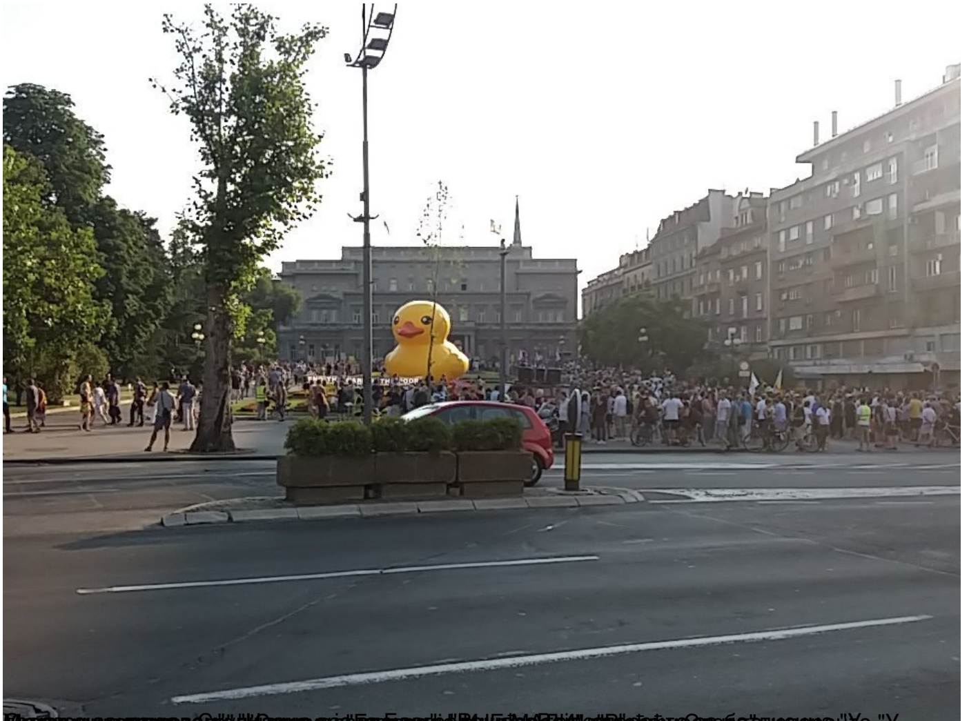
Масовна шетња грађана у Београду због рушења објеката у Савамали