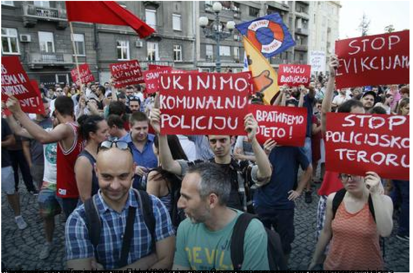
Београд, 13. јула 2016. Десетак хиљада грађана по пети пут у протестној шетњи због рушења објеката у Савамали