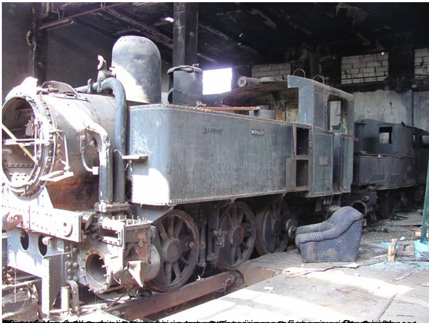
Београд: Најстарија локомотива из колекције Железничког музеја, направљена 1864. године, исеч