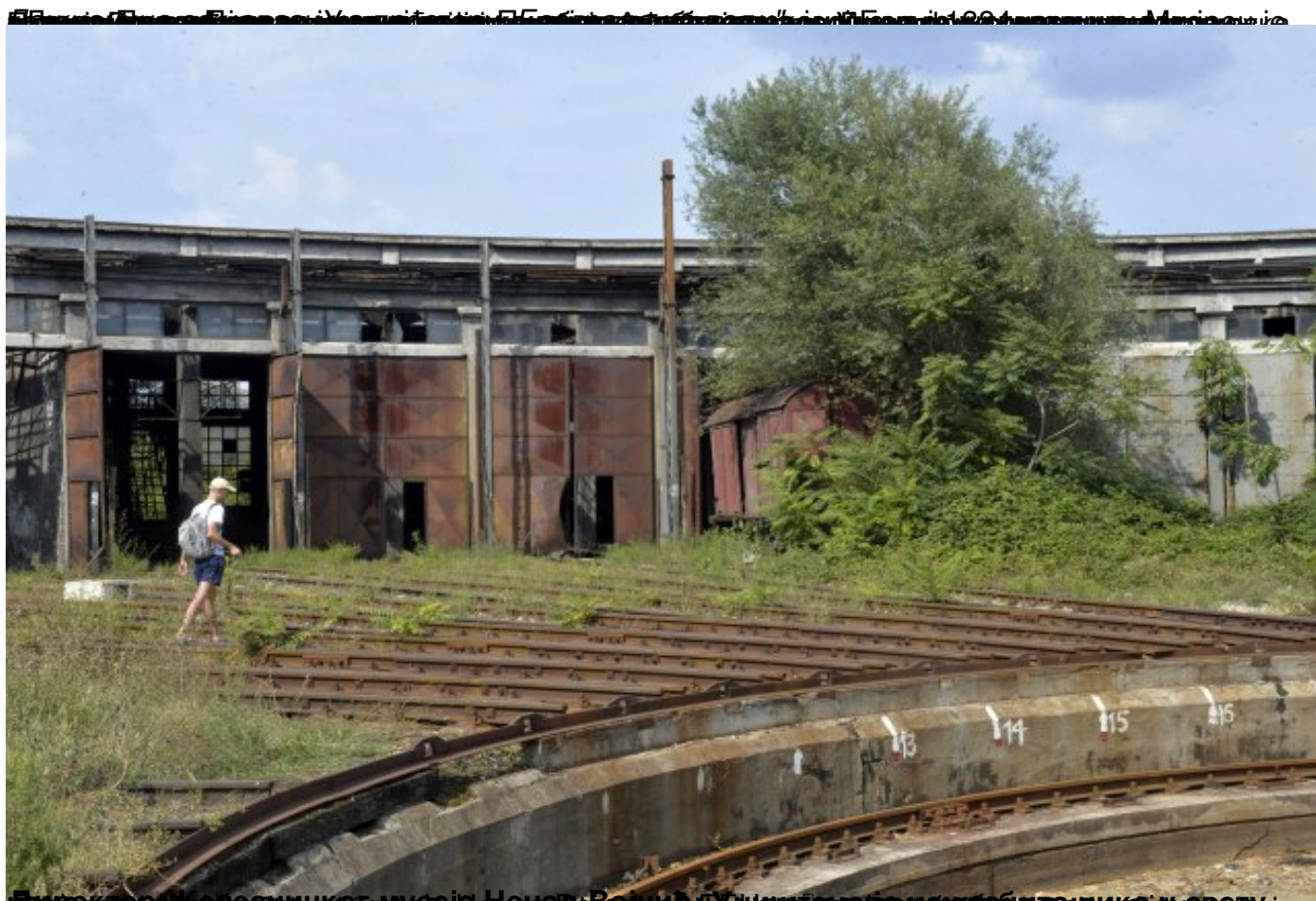
Најстарија локомотива из колекције Железничког музеја, направљена 1864. године, исече