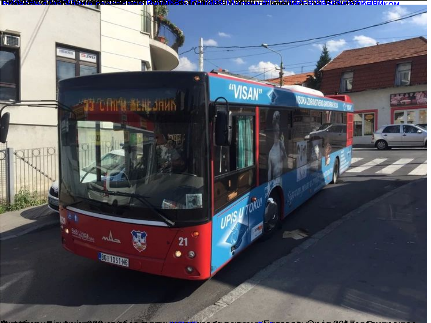
Италија: Београд: Аутобус на линији 55 целим точком пропао у рупу на асфалту, нема повређених