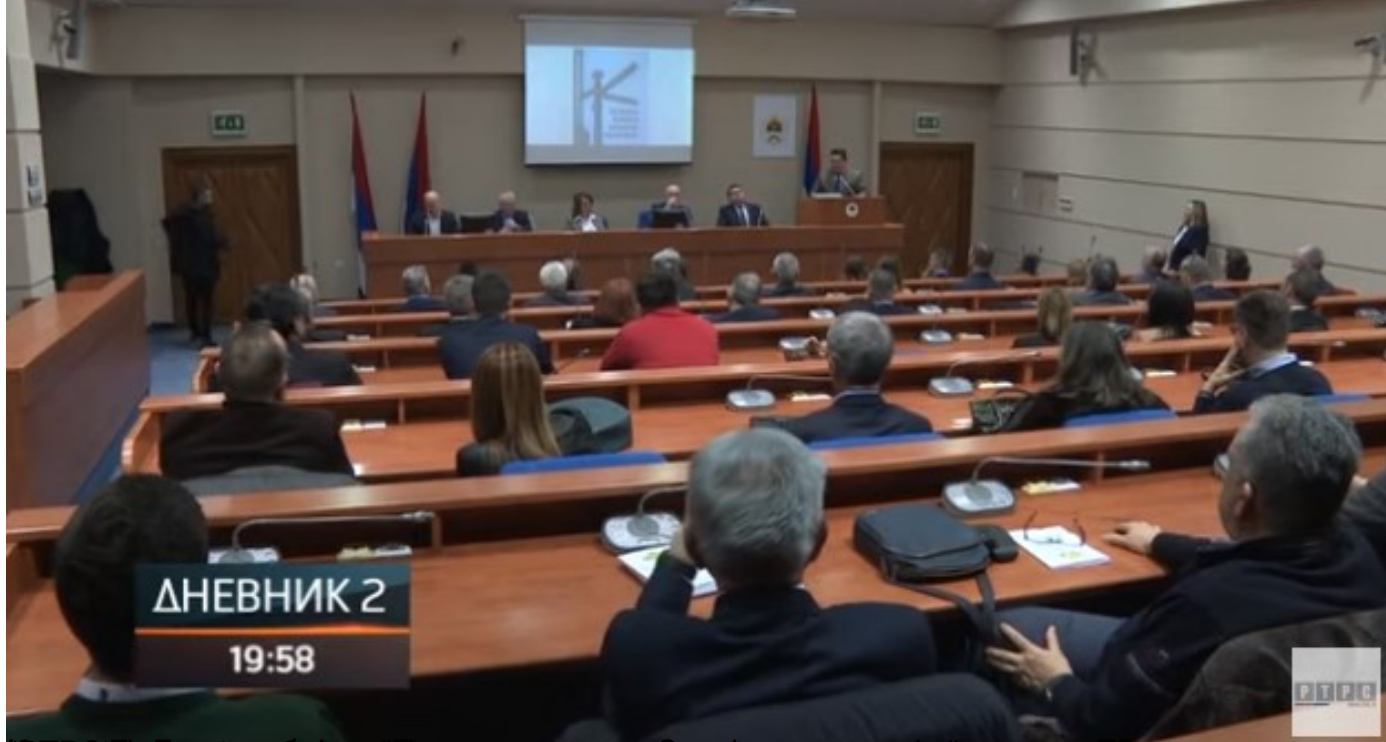
Како је у Баналуци, књига представљена у организацији Центра за истраживање и развој.