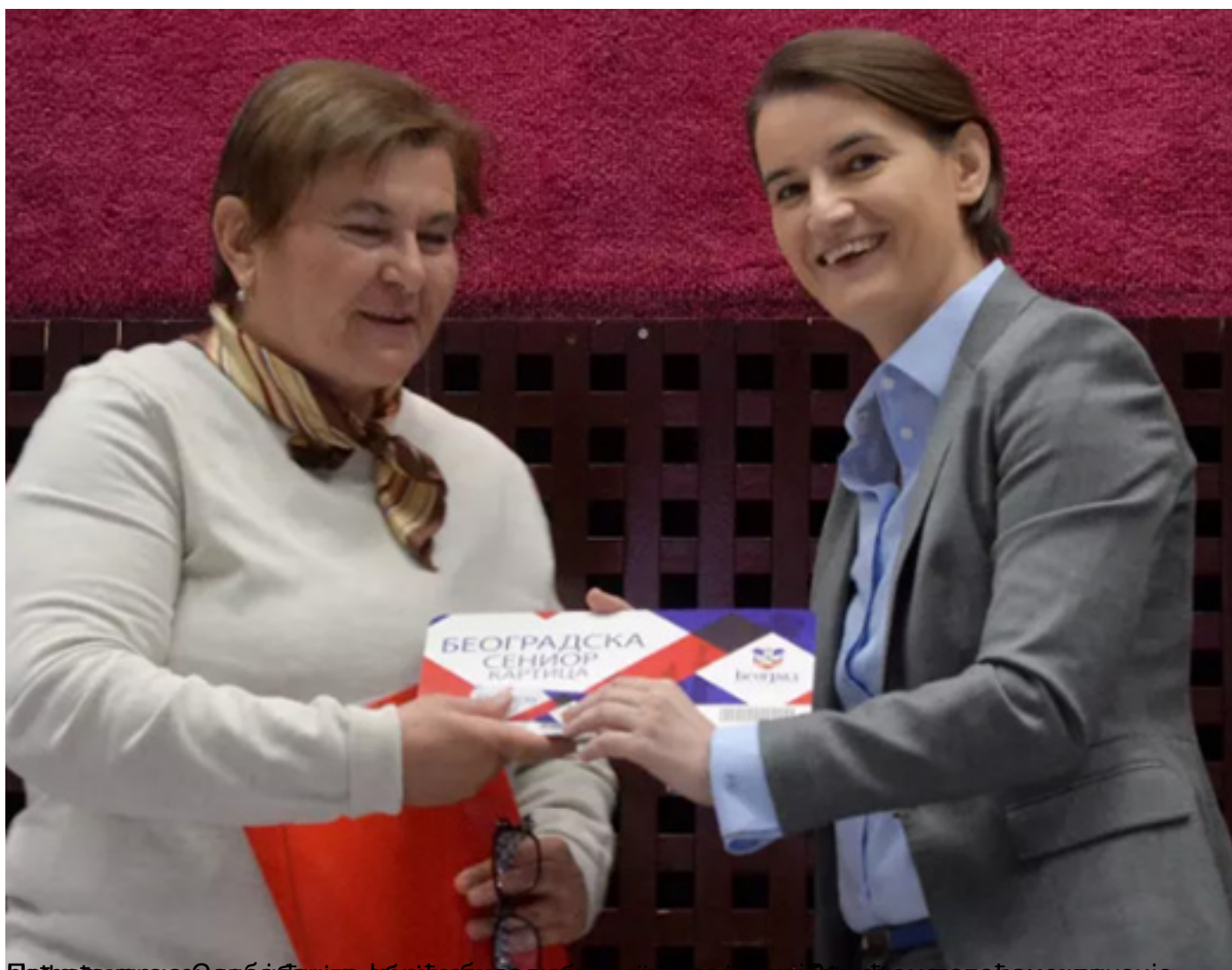
Београдска сениор картица је новина која ће бити у употреби од 1. новембра. На слици Ана Брнабић, председница Владе Србије, додељује картицу једној од учесница.