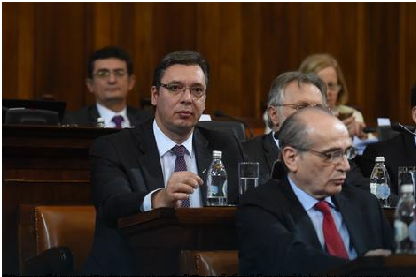
Александар Вучић у Скупштини: Не можете да нађете ниједног криминалца који данас управља Срп