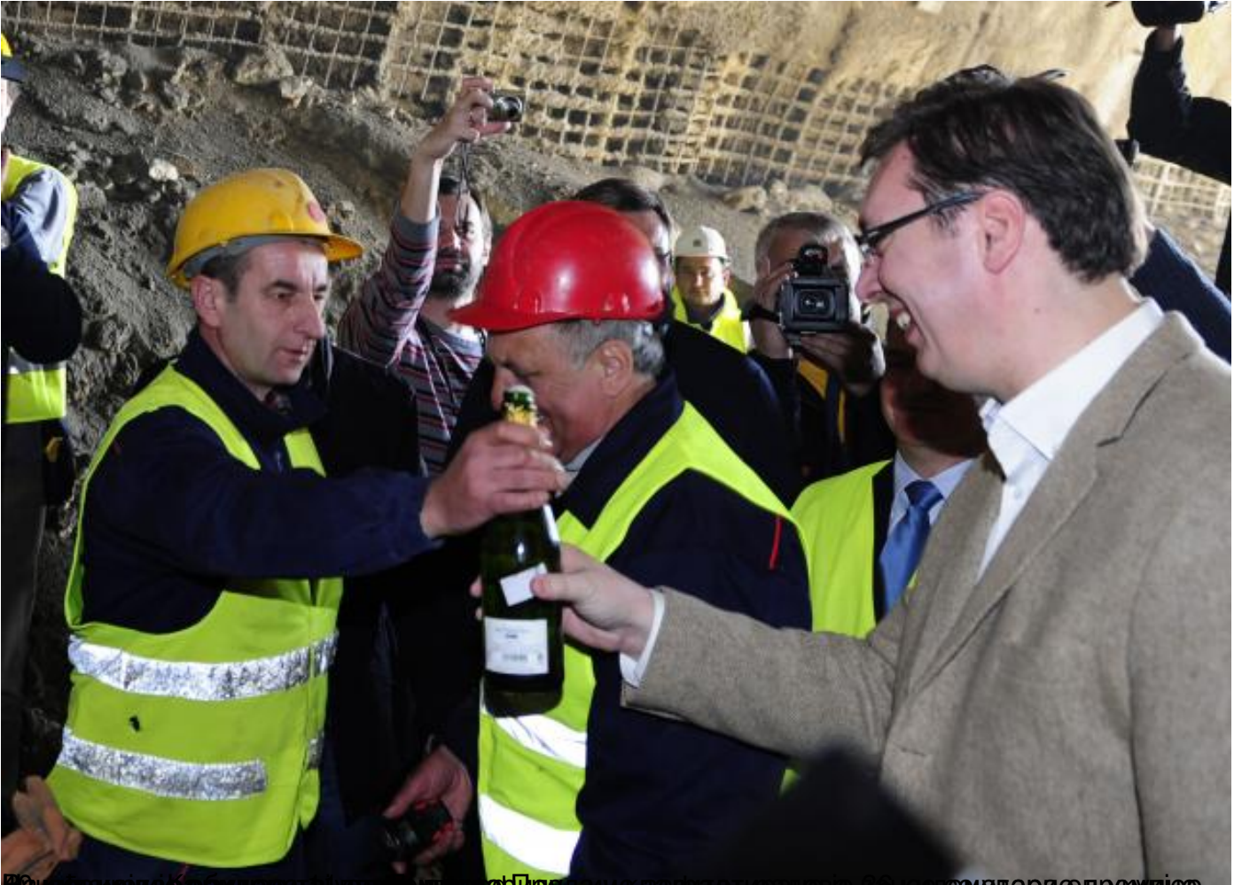
Вучић се поздравља са радницима на градилишту.