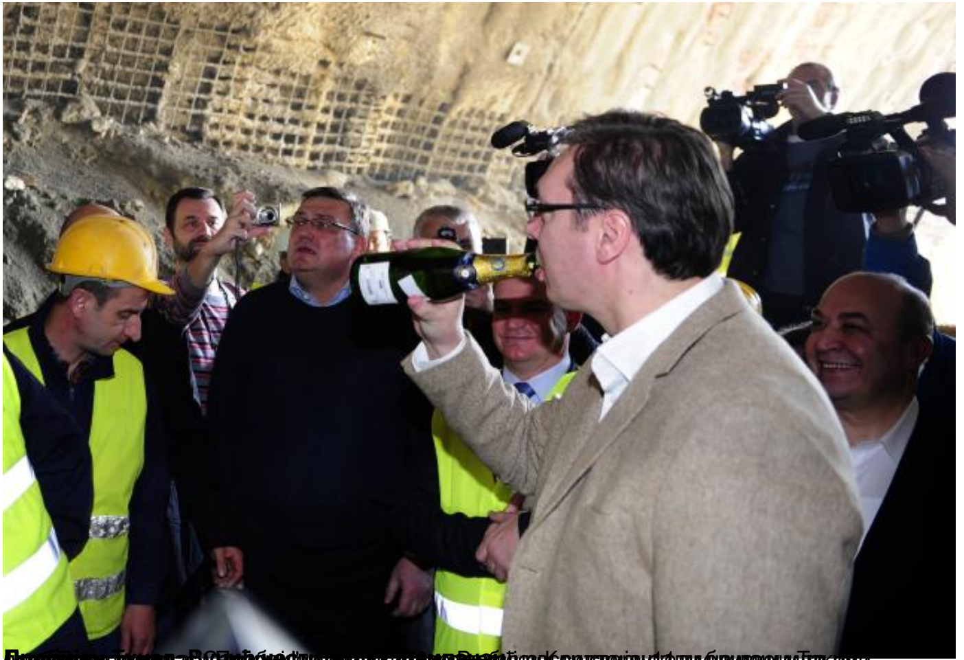
Др Александар Вучић, председник Републике Србије, са својим колегама и медијима на локалитету у Такову, где се изводи пројекат за изградњу магистрале Београд-Татун.