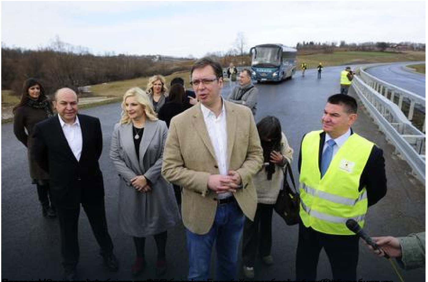
Београд, 01. фебруара 2016. Александар Вучић са својом породицом и осталим члановима Владе Србије посетио је нову станицу аутобуса у Београду.