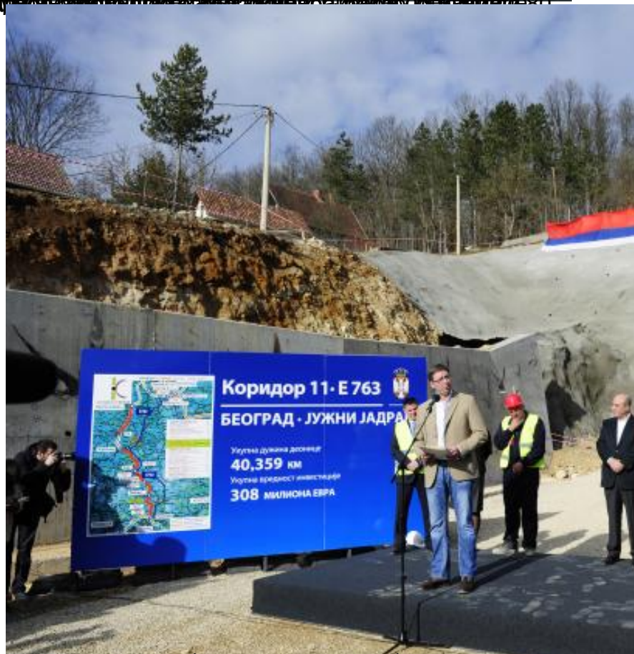
Вучић је на церемонији изјавио да је изградња магистрале Београд - Јужни Јадран од 46 километара дужине, која ће бити изградњена у две фазе, за