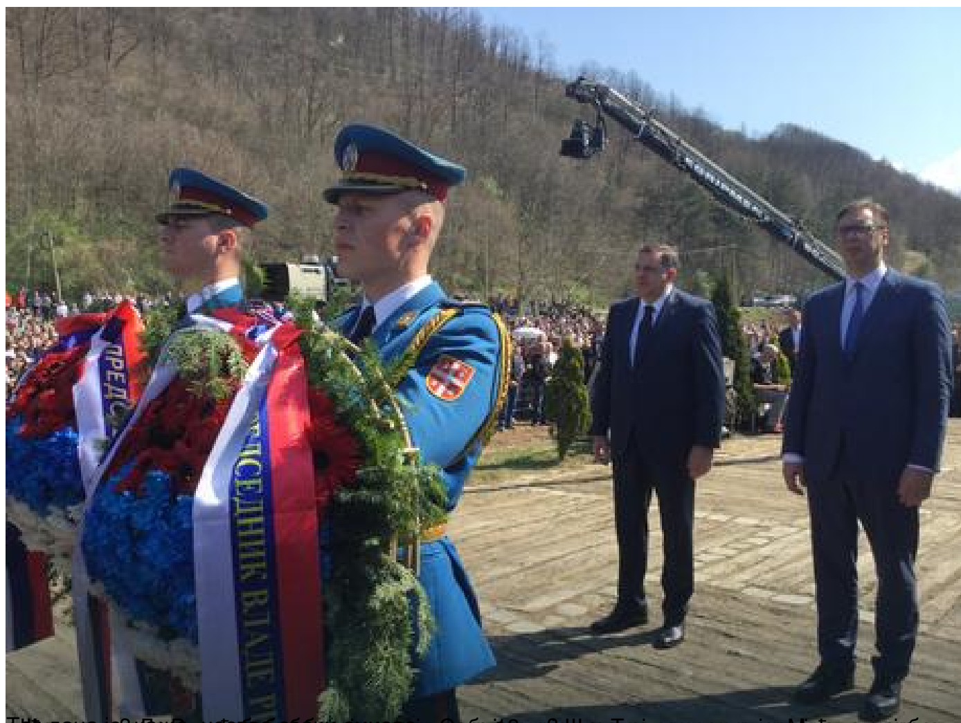
Датум: 24.03.2017. Место: Београд. Србија је део свет