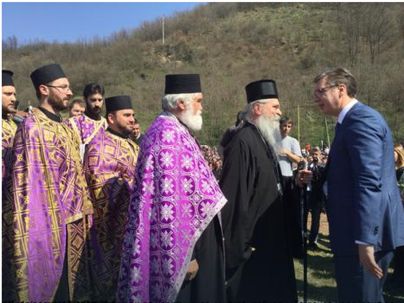
Српски патријарх и епископи са председником Србије Александаром Вучићем на обележавању 18 година од НАТО агресије у Београду, 24. марта 2017. године.