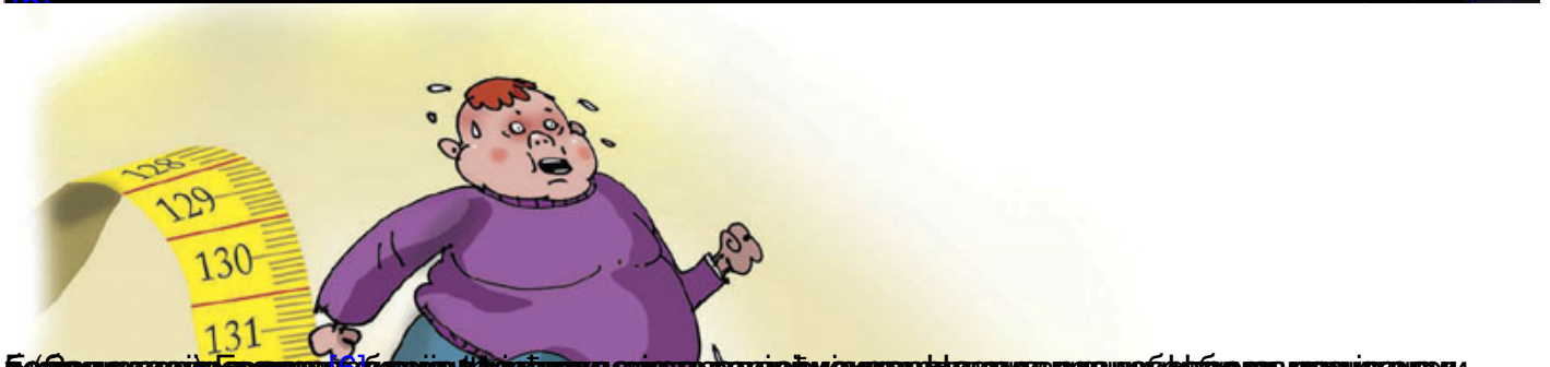
Prevalence of obesity among adults (2008)